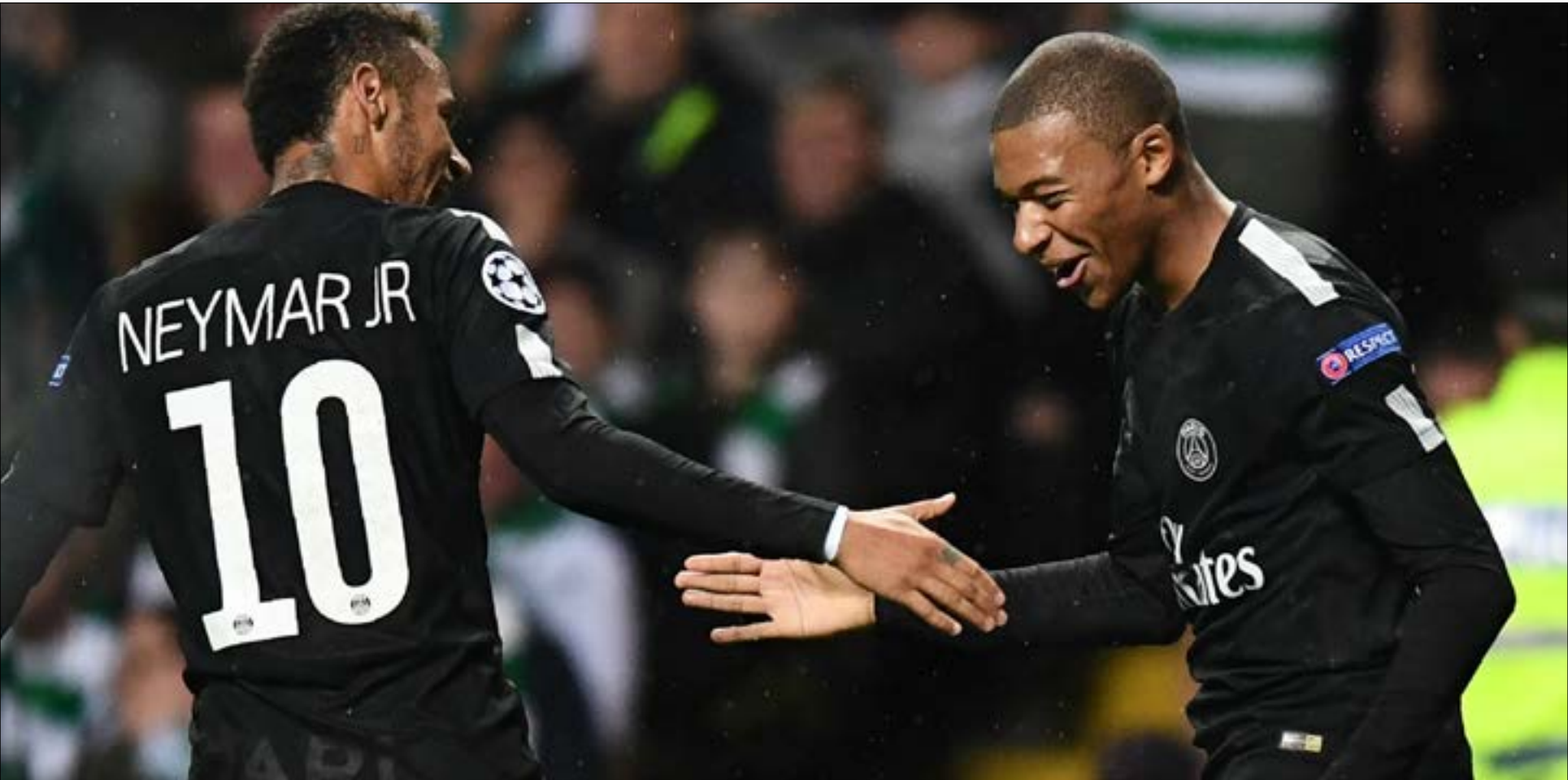
كسر مبابي الأرقام القياسية في المونديال الأخير (إرشيف)