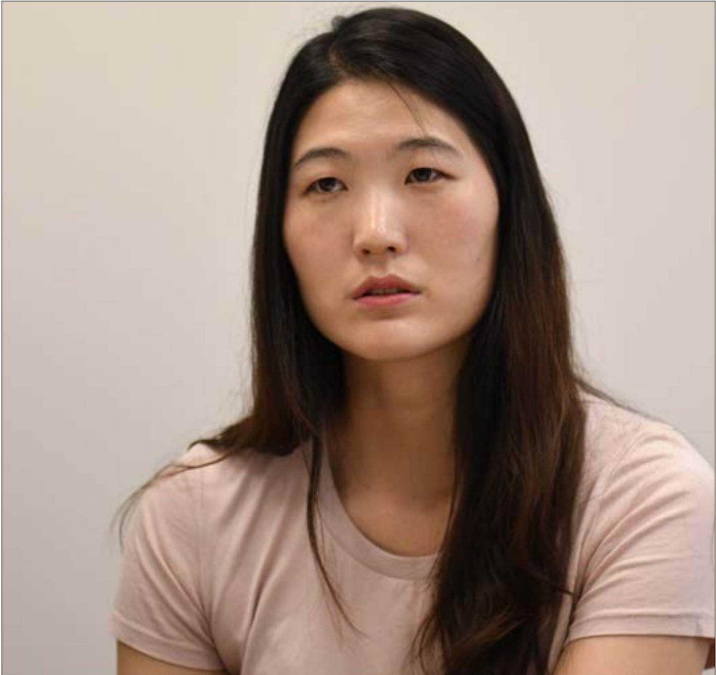
صحفحات الرياضيين ذكرتها بمغتصبها وأصبحت بالغفياح

الاصخبار — الجمعة 20 تموز 2018 العدد 3520