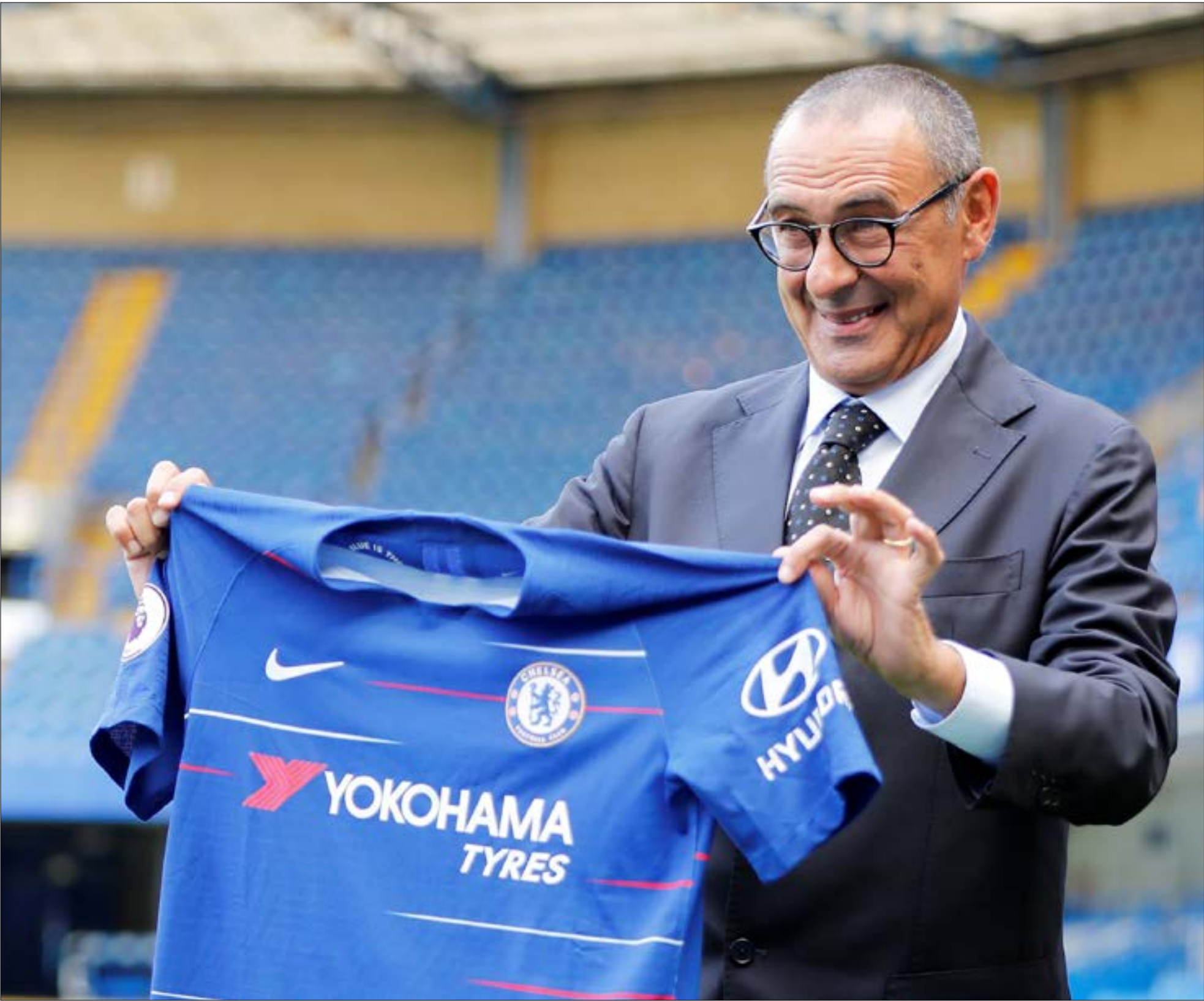
على عكس المدرب الإيطاليين التقليديين يفضله ساري اللعب الهجومي (تولفا كمت)

كونتي انتقلت إلى أغلبية الفرق الأخرى التي بدأت باعتماد هذه الخطة «السحرية» من قبل أحد عباقرة التدريب. وعلى سبيل المثال: لكنه موسم واحد انتهى بطريقة «وردية». الموسم الثاني لكونتي في ستامفورد بريدج لم يكن ممتلاً أو شبيهاً للموسم الأول «الأسطوري» فمن ثوب الجطل، انتقل كونتي ولاعوه لينهوا الموسم قابعين في المركز الخامس الذي لا يكفي لاستقدم عدة لاعبين على «مرزاجه» الخاص. النتيجة كانت إيجابية جداً، فالفوز بالدوري الإنكليزي ليس بالأمر السهل، خصوصاً أن هذه التجربة تعتبر الأولى لكونتي خارج أسوار إيطاليا. طريقة دفاعية 3-4-3 اعتمدها كونتي خلال جميع مباريات الدوري الموسم المقبل الماضي، مستغنياً أفكاره «ذاتها» التي كان قد اتبعها في يوفنتوس. انتقلت هذه الفكرة إلى معظم الفرق الإنكليزية. بتنا نلاحظ أن أفكار