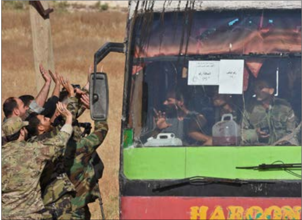
جنود يستقبلون إحدى الحافلات الواصلة إلى معبر العيس امس من كُفريا والفوعة

تنفيذه، عبر استهداف عدد من الجرافات التي كانت تعمل على فتح الطريق لإتاحة دخول الحافلات من مدينة البعث نحو مناطق سيطرة المسلحين. ومن المتوقع أن تنطلق اليوم، أولى الحافلات نحو الشمال، على أن تشمل عملية الترحيل كل الراغبين في ذلك من بلدات ريف درعا، مثل نوى وحاسم. هذه الإشكالات المحلية، حضرت أيضاً في محيط مدينة نوى؛ فبعدما تم الاتفاق على تمرکز الجيش في محيط المدينة، إعداد الحافلات. ولم يمر الاحوال للاتفاق من دون عراقيل، إذ حاول مسلحون لاستهداف الجيش في