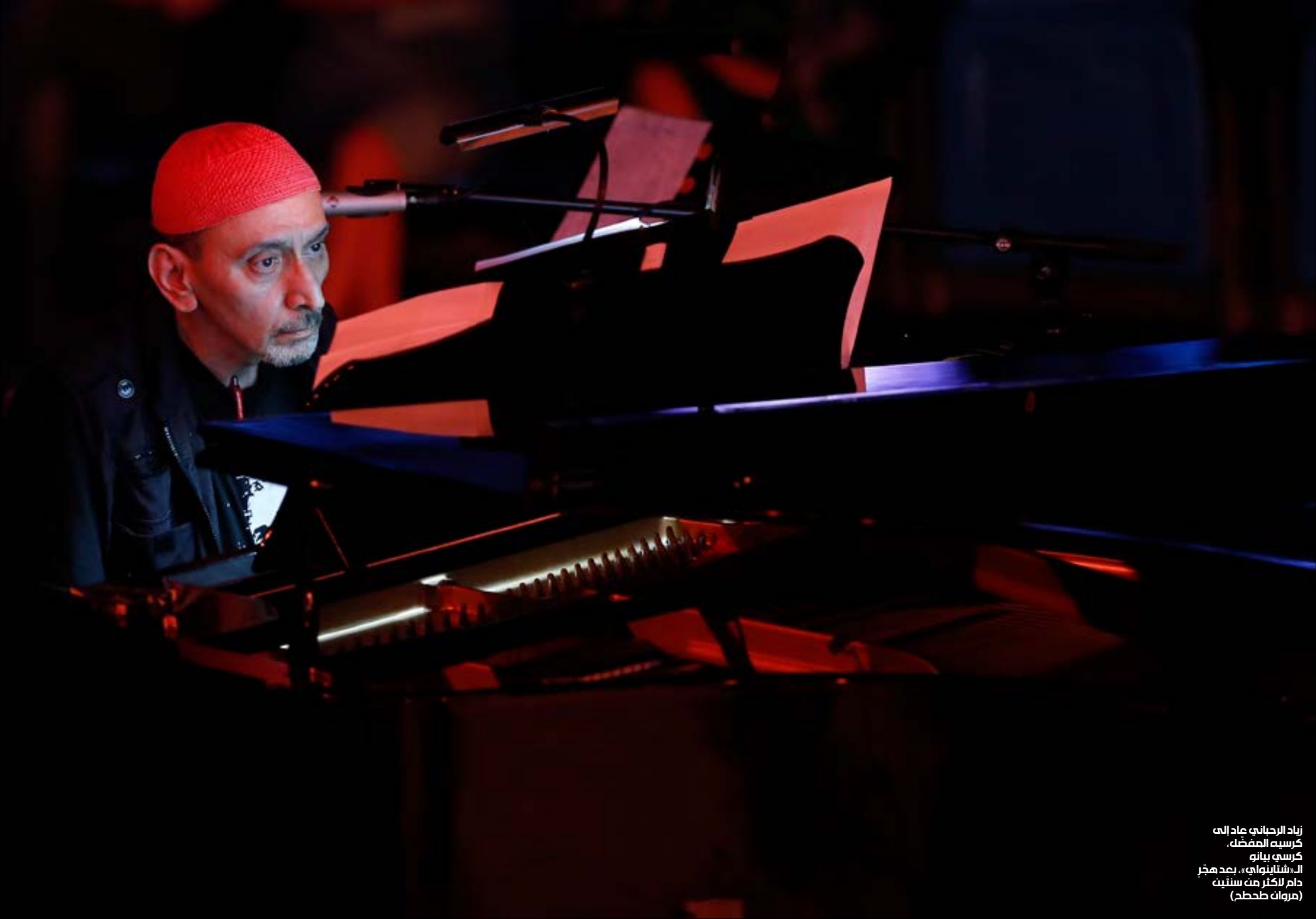
زياد الرحباني عاد إلى كرسية المفضل، كرسي بيانو «شتابنواي»، بعد هجر دام لأكثر من سنتين