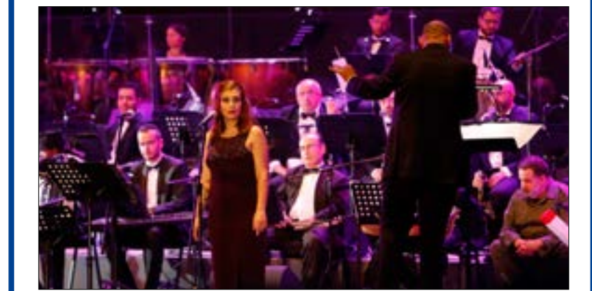
زياد الرحباني عاد إلى كرسية المفضل، كرسي بيانو «شتابنواي»، بعد هجر دام لأكثر من سنتين

من المستقر (والطبيعي!)، عموماً، أن ترى بعض الجمهور متلهياً بالتقاط الصور بهاتفه أو بتصوير لقطة فيديو. كذلك الأمر بالنسبة إلى الأحاديث التي تجري عن الحفلة خلالها. لكن المشهد كان شديد «الهضامة». مشهد شديد العفوية والصدق يجبرك على الابتسام لا الامتعاض. في القسم الأخير من الفصل الثاني للأمسية الثانية، وبعدما ارتاحت من ثقل إنجاز الافتتاح، شوهدت رئيسة المهرجان، نورا جنبلاط، بثيابها الـ sport chic التي تليق بها، واقفة بين المدرج والمسرح لجهة زياد، تراقب خروج ودخول الرجل من وإلى الكواليس. خلفها احتشدت مجموعة من الأصدقاء والمنظمين في نقطة تحجب الرؤية من زاويتهم. هكذا تولّت نقل «الصوت والصورة». كلما دعت الحاجة: تعيد على مسامعهم نكتة فانتمهم، تنقل لهم آخر أخبار التغييرات في الملابس التي يجريها زياد خلال الحفلة. ترصد كل حركة ذات معنى وتحاول إعادة إنتاجها بأمانة، قبل أن تسحب هاتفها وتشرع في التصوير، بشكل سرّي، ربما خوفاً من أن ينهرها المنظمون... فهي في هذه اللحظة بالذات ليست منهم، بل من المعجبات!