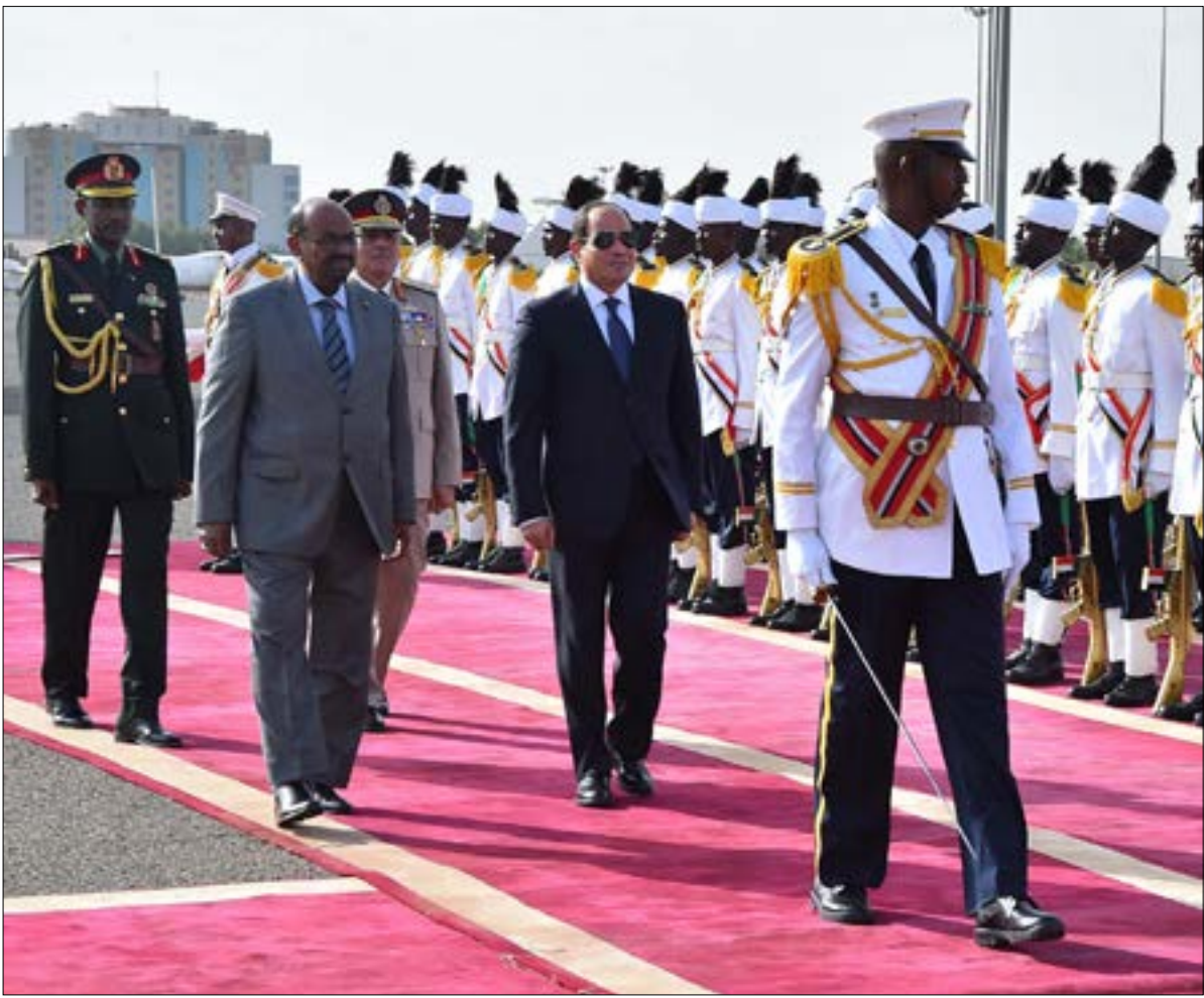
تأتي زيارة الرئيس المصري في أعقاب عودة التعاون الاثني بين البلدين