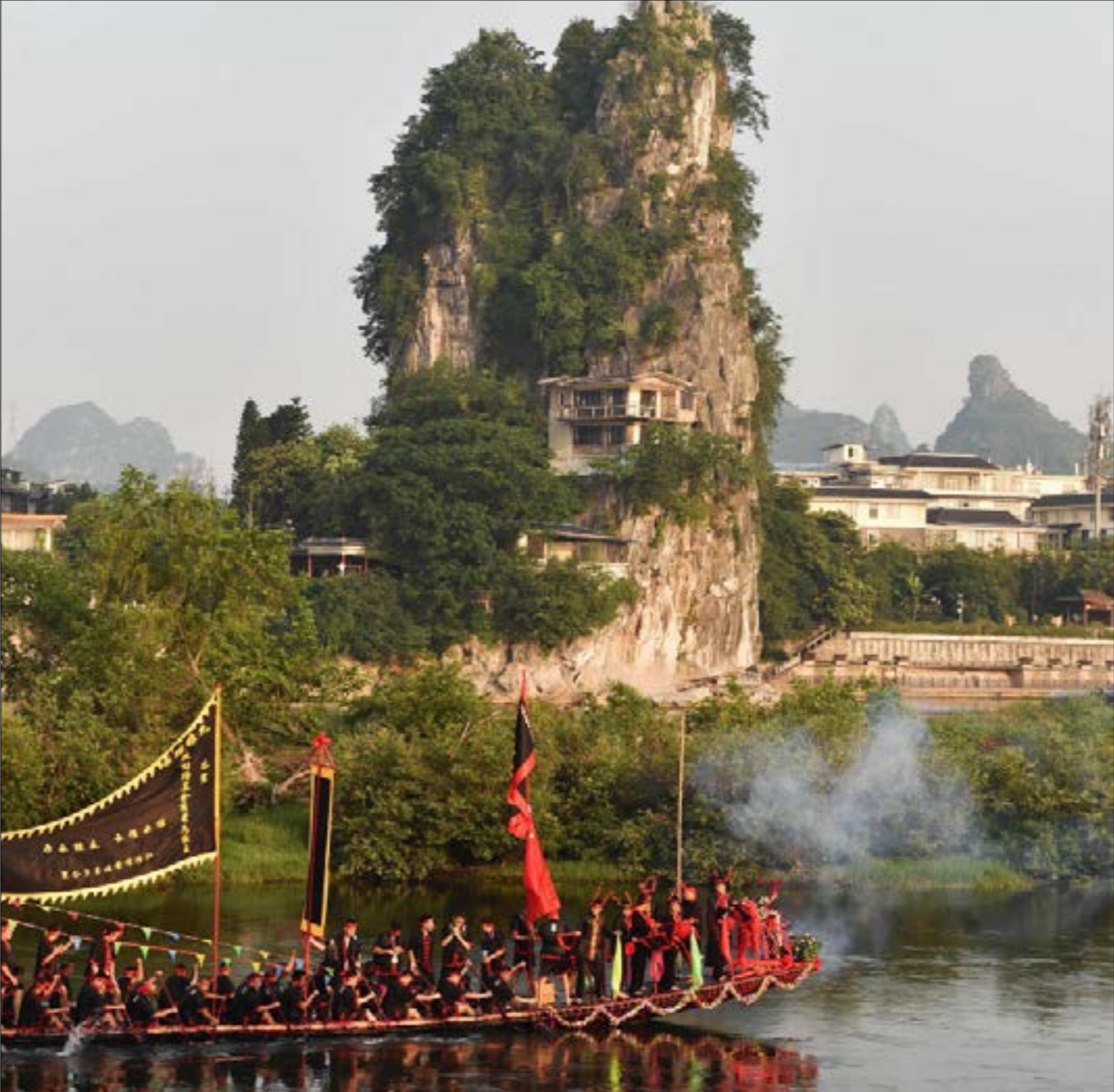
النظام الشيوعي والثورة الثقافية لا يزالان لبرهما قويا في الصين

إيمانويل والرشتاين، وهو أحد علماء علم الاجتماع الأميركي يقول: «إننا نعيش في عصر الرأسمالية وما يحرك العالم اليوم هو البحث عن الفائدة». والبحث عنها إنتاجاً واستهلاكاً لم يقتصر على الأشياء المادية، بل تسرب إلى العلاقات الوجدانية والاجتماعية بأنساقها المتعددة، وفي السياسة، الفائدة تعني الصفقات الرابحة، واحزاب وشخصيات بلا صفات ثابتة، وروابط تتحول إلى سلع، وانتهاء تاريخ صلاحية العلاقة، واكتساب مهارات الإنهاء