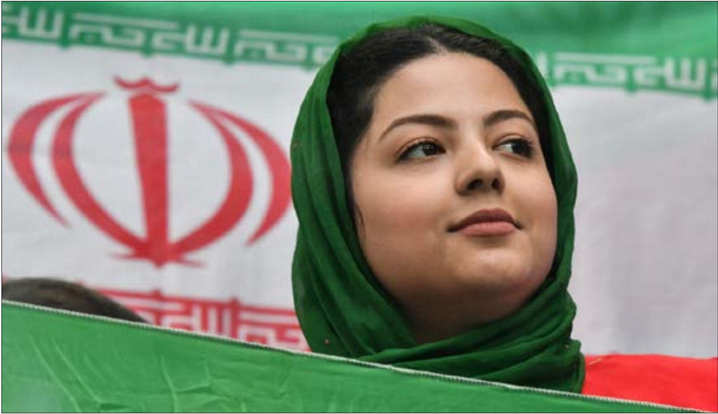
سحر الجمهور الإيراني «الأنيق»، سانت بطرسبرغ منذ وصوله إلى المدينة (ا ف ب)

مباراة إيران مع المغرب فرضت نفسها كأحد أهم مباريات كأس العالم مع الجو الكرنفالي الصادر عن المشجعين والمشجعات. وفي النهاية، كان الهدف المباغت في الوقت بدل الضائع كافياً لضمان فوز إيران الثاني فقط في تاريخ كأس العالم. في تصريح لأحد المشجعين يقول: «هذا الفوز أعطاني الأمل في أن تحصل إيران على كأس العالم في يوم من الأيام. وسيكون الجميع قادراً على مشاهدته، حتى النساء».