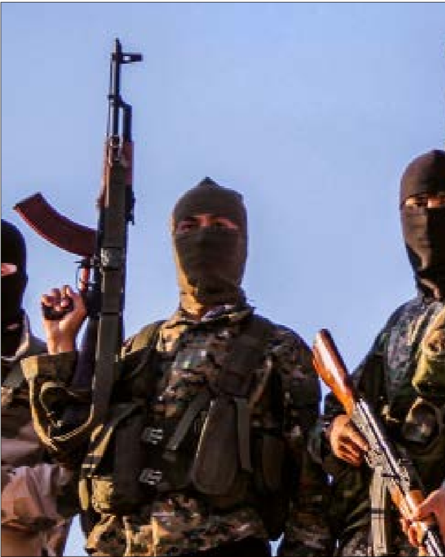
امرزت التحوّلات الجديدة لخطاب داعش، بعض كوادر «التركستاني» (مجلة تركستان الإسلامية)

امام الأراء الأخرى، فأشار إلى وجود «استثناءات» تفرّضها المعطيات «الجهاديّة» بشكل عام، من دون أن يعدم «الأدلة الشرعيّة» التي تؤكّد «صواب» كلّ من الموقفين المتناقضين. شدّدت «الفتوى» على وجوب «إتمام الجهاد في الشام حتى يقضي الله أمراً كان مفعولاً»، مبيحة في الوقت نفسه لمن لم يبرزز «بعد أن يبقى في بلاده استعداداً لهالجهاد العدو القريب». الخلاصة التي حاولت «الفتوى» الخروج بها تتمحور حول تخيير الأويغور المقيمين في الصين بين «التفجير» إلى الشام، أو الاستعداد لهالجهاد» في بلادهم متى دقّت ساعته. أما الموجودون في سوريا حتى الآن، فقد حرصت «الفتوى» على تأكيد وجوب التزامهم بقرار «امراء الجماعة» في شأن «الفتور» وأوليائها، مع التركيز على تحريم «التحوّل من ثغر إلى ثغر من دون إذن الأمير». وتُشكّل هذه «الفتوى» سادقة من نوعها في مسار «الحزب التركستاني»: فطوال الأعوام الخمسة الماضية كان التنظيم المتطرّف وداعموه قد حرصوا على الترويج لهالهجرة إلى