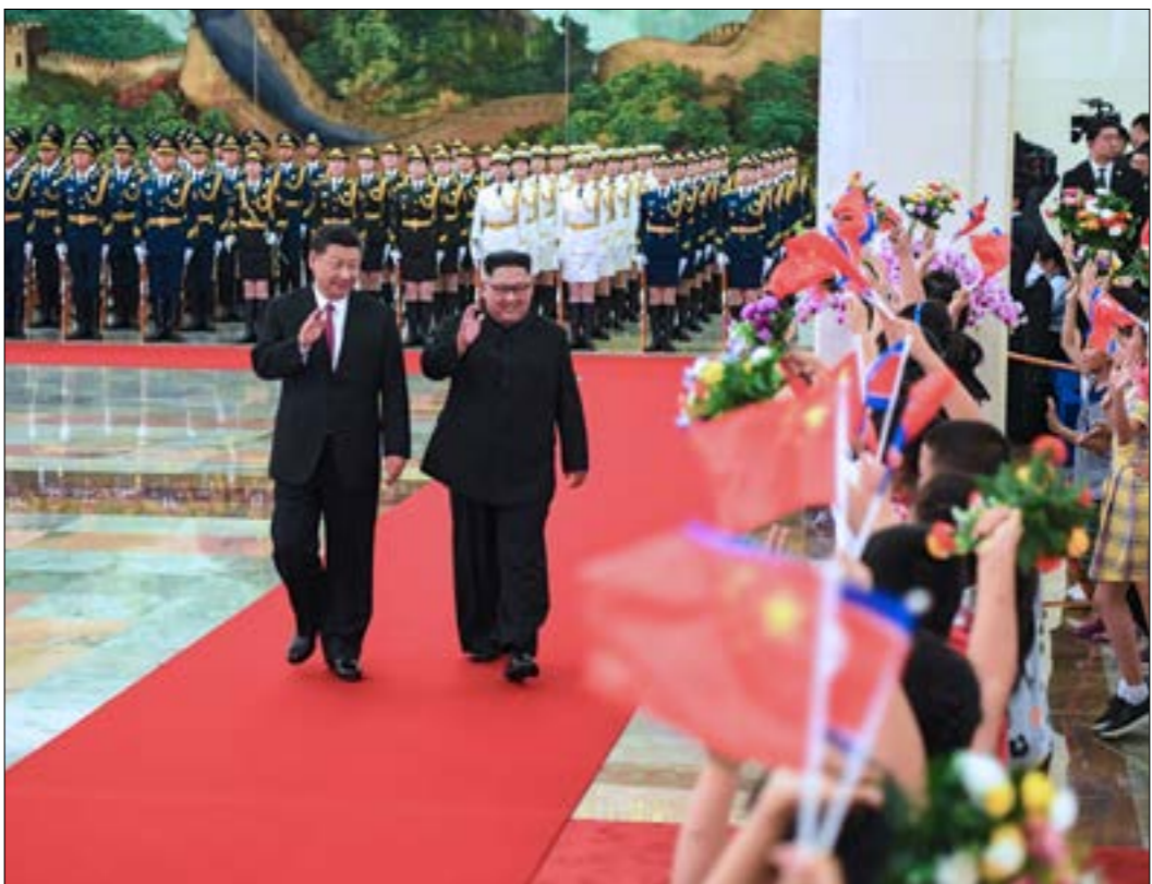
هذه لالت زيارة يقوم بها الزعيم الكوري للصين في اقل من ثلاثة اشهر

استقبل الرئيس الصيني شي جين بينج، الزعيم الكوري الشمالي، كيم جونج أون، أمس، بمراسم عسكرية في قاعة الشعب الكبرى في بكين. وكان كيم قد وصل إلى بكين في زيارة لمدة يومين، من المتوقع أن يطلع خلالها القادة الصينيين على ما تم في القمة التي جمعتها بالرئيس الأميركي، دونالد ترامب، في سنغافورة الاسبوع الماضي، وبحثت محطة التلفزيون الحكومية الصينية «سي سي تي في» مشاهد للرئيسين خلال مراسم استقبال في قصر الشعب.