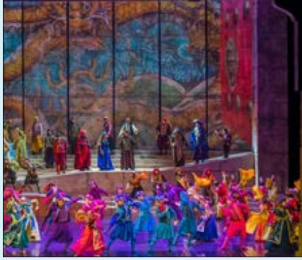
من عروض «كركلا»: عناف مدينيتي الشمس والحرف