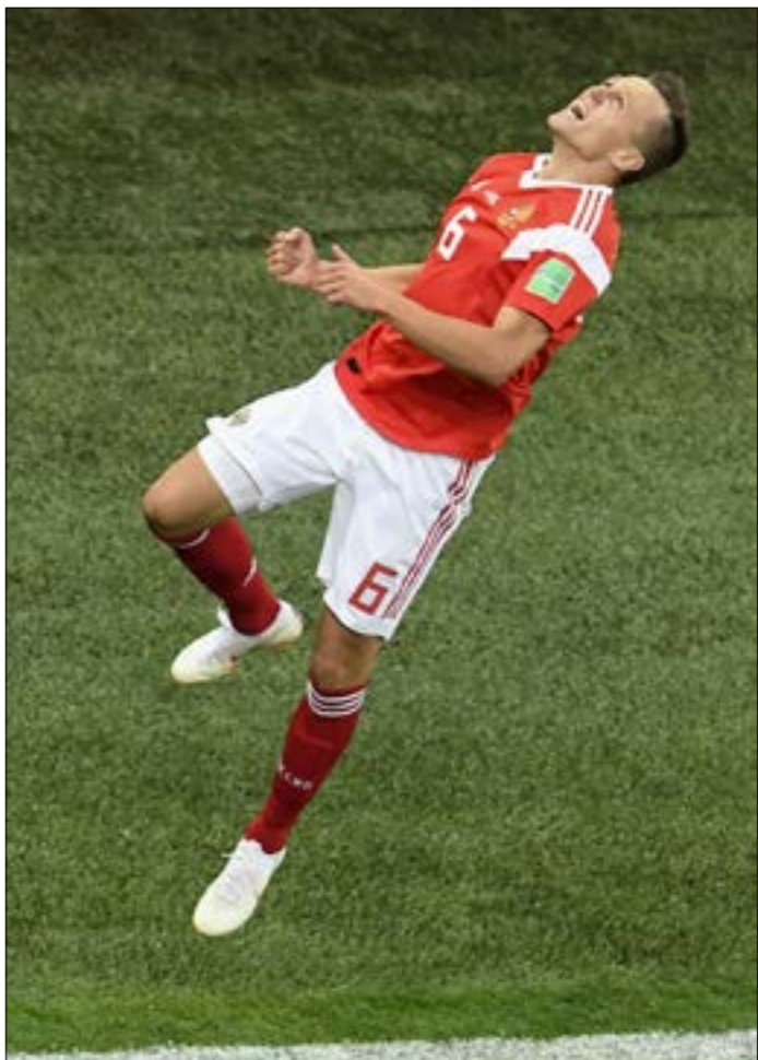
روسيا هي اول المتاهلثة إلى الدور الثاني