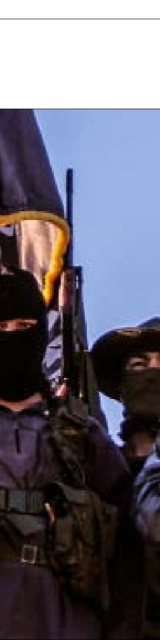
امرزت التحوّلات الجديدة لخطاب داعش، بعض كوادر «التركستاني» (مجلة تركستان الإسلامية)

بين أولويات «الجهاد» في المرحلة الراهنة، ما بين قائل بوجود مصادر «جهاديّة» موثوقة تأكدها أنّ «الحزب التركستاني بدأ أخيراً بتسجيل أسماء بعض الشبان الأويغور الراغبين في مغادرة سوريا نهائياً والانتقال إلى الجهاد في بلدان أخرى». وفي خلال الشهر السنّة المنصرمة انضّحت الصورة أكثر، وتبيّن أنّ المرحلة الراهنة قد خصّصت لدخول «الحزب الإسلامي التركستاني» على خطّ «عولمة الجهاد»، والعمل على استعمار الساحة السورية إعلامياً لاجتذاب كوادر «جهاديين» من غير أبناء العراق الأويغوري، في خطوة تمثّل سابقة في سجل «الحزب» المتطرّف «الأخبار»، 23 أيار 2018). في الوقت نفسه أظهرت الأدراع الإعلامية لهالتركستاني» اهتماماً بالعناصر «الجهاديين» السوريّين، وحرصت على إيلاء «الانتصار» اهتماماً خاصاً، في ما يبدو خطوة لسدّ الفراغ الذي سيخلفه «الجهاديون الأويغور» المغادرون سوريا.