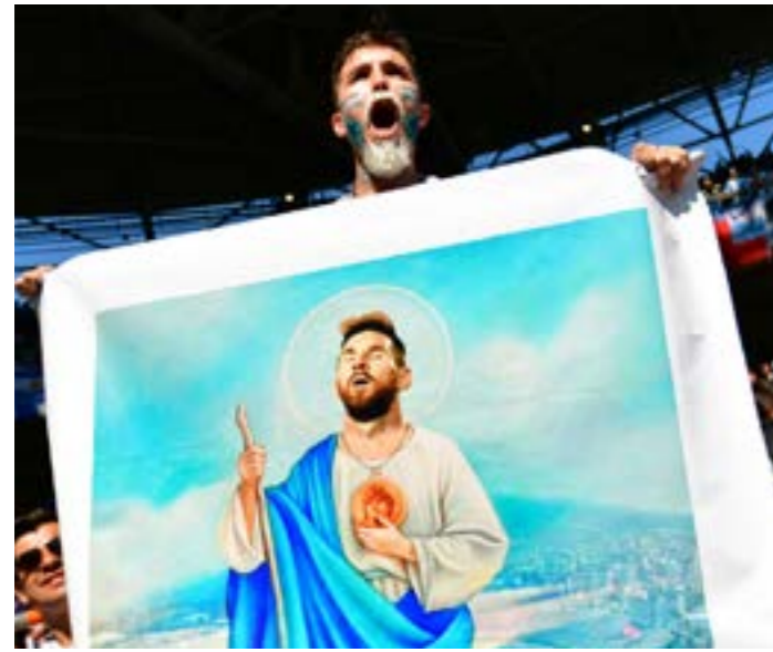
ميسي مطالب أكثر من رونالدو بالفوز بكأس العالم

الأهداف وحصد الانتصارات. هو بتسجيله للكرة الحرة بتلك الروعة وفي وقت حساس من عمر المباراة ووسط ضغط جماهيري كبير ويقدم تعبت جراء الركن المتواصل، يعد بطلاً حقيقياً المثل الذي يظهر معدنه في اللحظات الحاسمة، والتي حمل فيها سبياً خاصاً آخر ليهدد «الأرصاد» بذاك «الهاتريك»، إن قبل دخوله المباراة كانت المطالبة بسجنه في إسبانيا بسبب التهرب الضريبي. كما أن مواجهته الخاصة مع زملائه في ريال مدريد حيث نصب نفسه «ملكاً» عليهم أعطت دفعا إضافياً لمحركاته الخارقة التي جعلت منه أفضل لاعب في العالم. في المقابل، يقف هناك نجم صاحب موهبة فطرية قل نظيرها في عالم الكرة وقفة مطالب فيها بتحقيق المستحيل، فتعمت تلك الموهبة تحولت