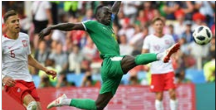
سيواجه المنتخب السنغالي في المباراة الثانية اليابان (ا ف ب)

استهلّت السنغال عودتها إلى النهائيات للمرة الأولى منذ أن فاجأت العالم بانتصارها على فرنسا في افتتاح كأس العالم كوريا واليابان 2002، بفوزها غير المتوقع على بولندا (1-2) في موسكو، ضمن الجولة الأولى من منافسات المجموعة الثامنة لمونديال روسيا 2018.