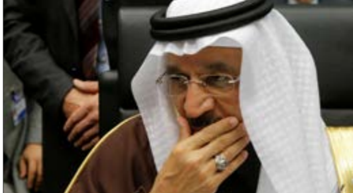
(الأخبار، رويترز، أ ف ب)

بشكل مراهق في الدوام السعودية وبرحون كونها خاصة للضغوط الأميركية