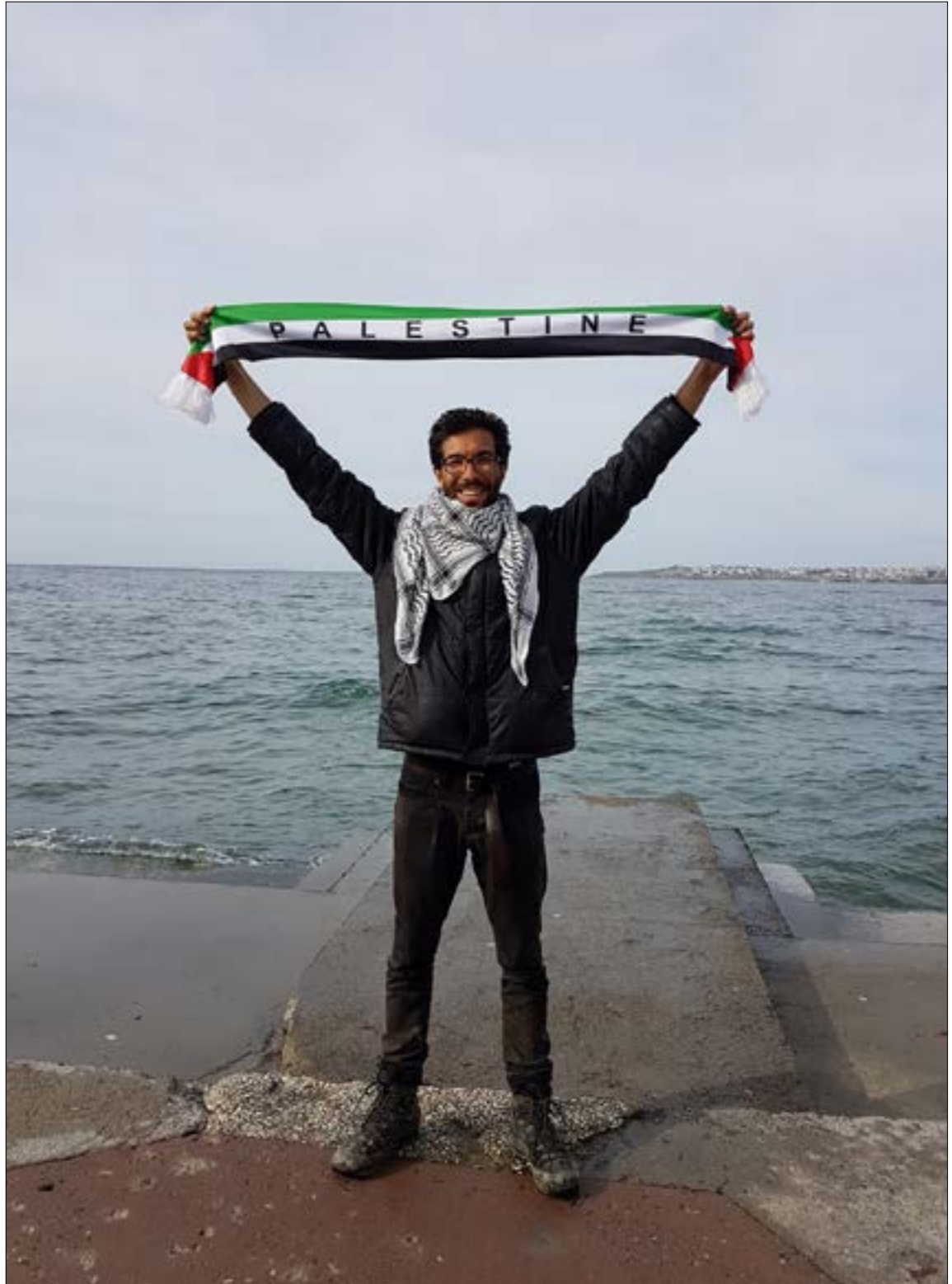
سار الحدرا 4500 كيلومتر (الأخبار)