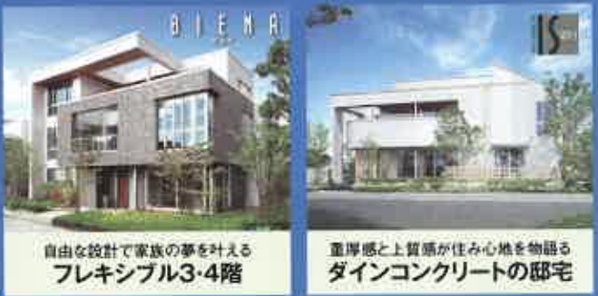
自由な設計で家族の夢を叶える フレキシブル3・4階