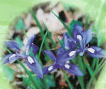
絶滅危惧種ひめあやめ