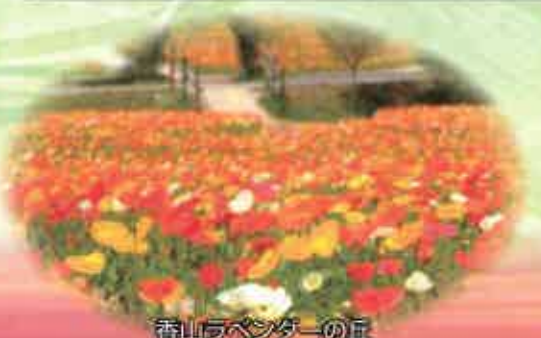
香山ラベンダーの丘