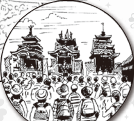
垂井曳軸まつり会場