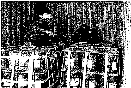
キャンプバージニアにおける弾薬コンテナの作成