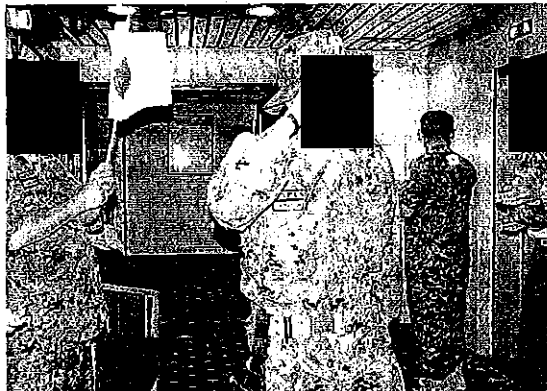
分遣班要員のキャンプバージニア移動支援