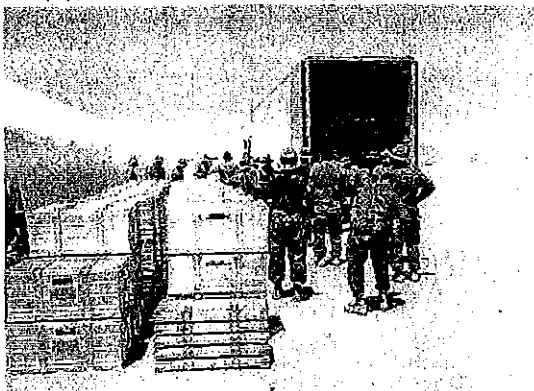
個人コンテナ等の検数・検量支援(帰国第2波)