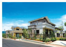
西武飯能・日高分譲地