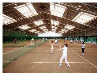
インドアテニスコート

メットライフドームに隣接、豊かな緑に囲まれたアウトドアクレーコート(4面)とインドアクレーコート(6面)があります。インドアテニススクールは天候に左右されずスケジュールも予定通り。貸用具も備えています。