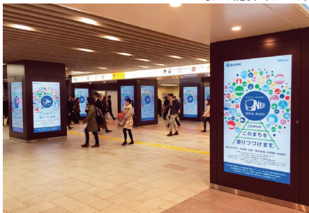
デジタルサイネージ(池袋駅地下改札外)