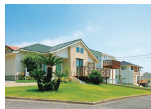
南房総・御宿西武グリーンタウン