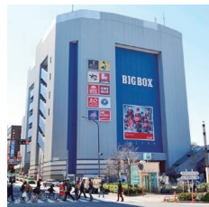
屋外広告(BIGBOX高田馬場)

新たな発想によるスペースの有効活用や、購買行動に直接結びつくような掲出アイデアの実践を行っています。BIGBOX高田馬場壁面の屋外広告など、レジャー施設の広告営業も行っています。