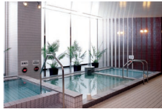
温浴(高濃度人工炭酸泉)

トレーニングジム・スタジオ・充実スパに、天然岩盤のホットヨガスタジオ(女性専用)を完備。ロッカーはスーツやコートも楽々収納可能なロングタイプ。会社帰りでもお気軽にご利用いただけます。