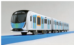
オリジナルプラレール「西武鉄道40000系」

TOMONYでは、西武鉄道グッズを取り扱っています。当社の電車がデザインされた日用品や雑貨など、大人からお子さままで幅広い世代のお客さまに好評を得ています。