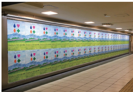
駅ばり(池袋ビッグボード)

駅の空間特性を生かした広告で「駅ばり」「サインボード(看板)」「インパクトアド(特殊広告)」「デジタルサイネージ(映像広告)」などがあり、多様でダイナミックな表現が可能です。乗降の多い駅への集中的な掲出や、駅全体のジャック広告など多種多様なPRができます。