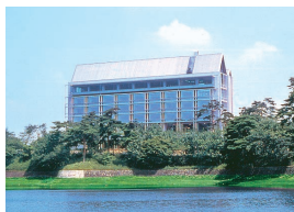
多摩湖畔にたたずむ掬水亭

森と湖に囲まれ、全室から多摩湖を一望できる中国割烹旅館 掬水亭。四季折々の景観を楽しむながらご宿泊、ご宴会、個室会食にご利用いただけます。また、大浴場「狭山の茶湯」とおしゃべり処 杏仁豆腐カフェ 桜梅桃李は日帰りでもお楽しみいただけます。