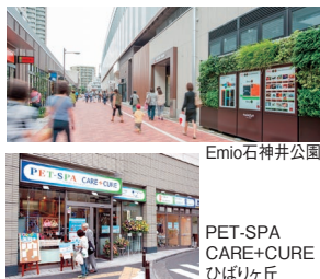
新横浜スクエアビル

線路高架下用地をクローゼット事業者へ賃貸。便利な収納スペースとして、近隣の多くのお客さまにご利用いただいています。