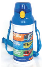
西武鉄道×プラレール ワンタッチプラボトル