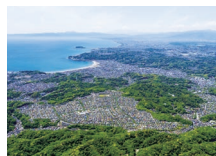
鎌倉逗子ハイランド