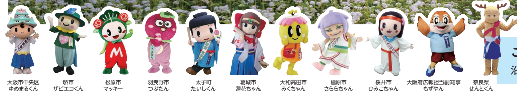
大阪市中央区 ゆめまるくん 堺市 ギャビエッタくん 松原市 マッキー 羽曳野市 つぶたん 太子町 たいしくん 葛城市 蓮花ちゃん 大和高田市 みくちゃん 橿原市 さらちゃん 桜井市 ひみこちゃん 大阪府広務担当副知事 もずやん 奈良県 せんたくん