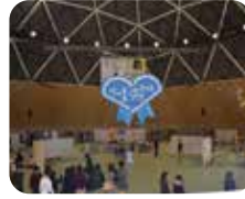
リニモ沿線合同大学祭(写真は昨年度の様子)

保見駅 八柱神社 徳翁院 交流センター 地球市民 モリコロパーク (リニモ愛環地球博記念公園)