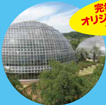
東谷山フルーツパーク