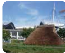
曾根遺跡公園と豊田スタジアム

三河豊田駅 枝下緑道 竜宮橋 加茂川水門 曾根遺跡公園 豊田スタジアム 豊田大橋 KITARA 豊田産業文化センター (新豊田駅)