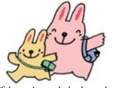
ぼぼちゃん、さわちゃん

2 伊豆半島ジオパークミュージアム ジオリア(修善寺総合会館) イベント情報 ※ゴール独鈷の湯公園から修善寺温泉バス乗り場へ行かれる際は、の道をお歩きください。