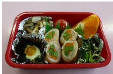
< 2級…お弁当 >