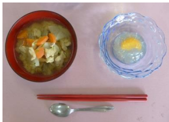
< 3級…指定料理2品 >

弓削高校では、全国高等学校家庭科食物調理技術検定を受検しています。12月で、平成26年度の検定が全て終わりました。練習は大変でしたが、技術が身に付き、合格が自信につながったようです。