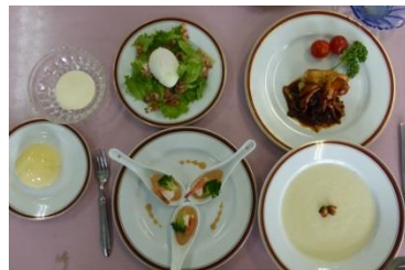
< 1級…フルコース >