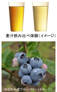
麦汁飲み比べ体験(イメージ)