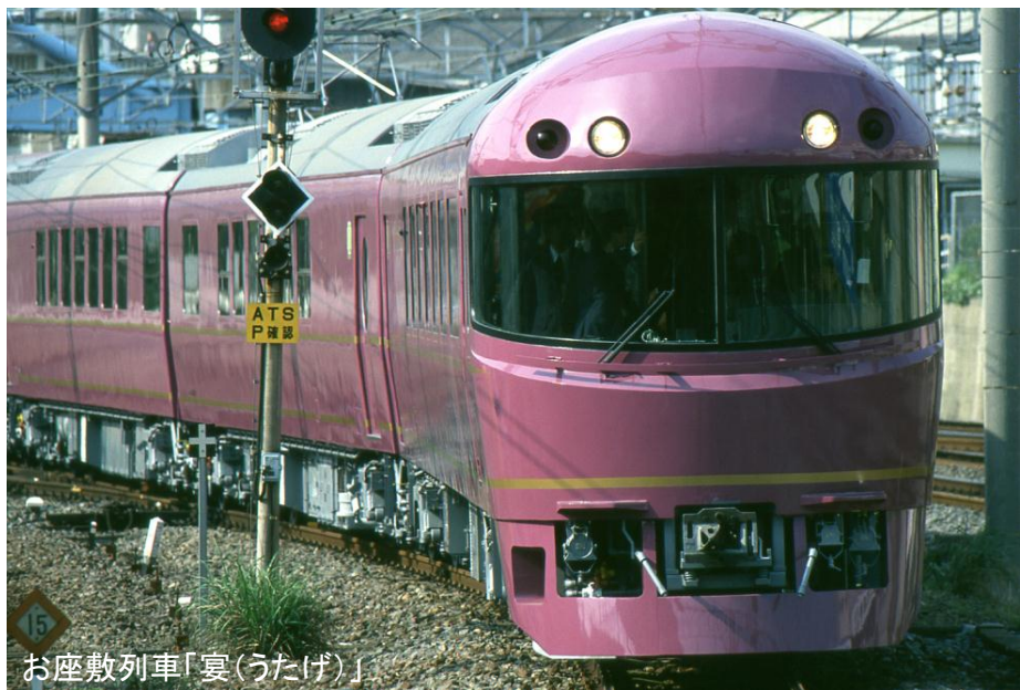
お座敷列車「宴(うたげ)」

みなかみ町・みなかみ町観光協会から ちよっぴりフルーツ（ブルーベリー【お持ち帰り】）付