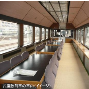
お座敷列車の車内(イメージ)

旅行期日 平成27年 7月17日（金）日帰り 募集人員 130名 最少催行人員70名 旅行代金 高崎駅・高崎問屋町駅・井野駅・新前橋駅・前橋駅発着 おとなお一人様 5,600円