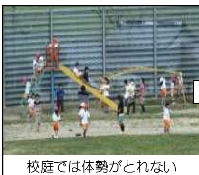
校庭では体勢がとれない