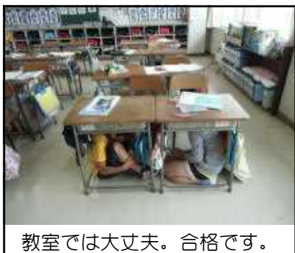
教室では大丈夫。合格です。

訓練以外にも安全の授業は積み重ねてきましたが、今回の子どもたちの動きを見て、私たち教師も日頃の指導についておおいに反省させられました。「いつ、どこにいても、自分の身を守る体勢をとれる（一時避難）」ように、しっかりと教えていきます。