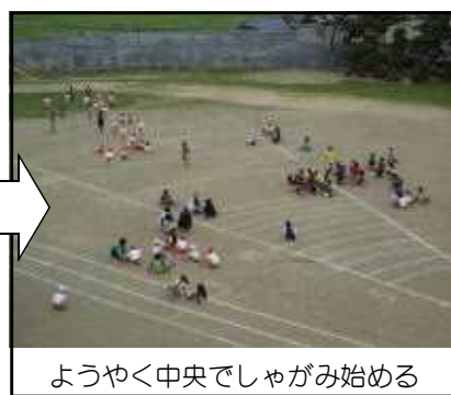
ようやく中央でしゃがみ始める