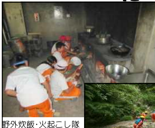
野外炊飯・火起こし隊

6月2日～4日、5年生が花山野外活動に行ってきました。1日目は、館内&館外オリエンテーリング、野外炊飯、夜間ハイク。2日目は、ウォークラリー、沢遊び、キャンプファイヤー。3日目は、焼き板づくり。というプログラムでした。