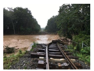
【橋りょう流失】 根室線 新得～十勝清水 第1佐幌川橋りょう