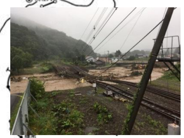
【橋りょう流失・路盤流出】 根室線 新得構内 下新得川橋りょう