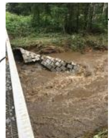
【護岸変状】 根室線 羽帯～御影 155k304m付近 魚捕川橋りょう