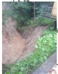
【護岸変状】 石勝線 トمام～新得 105k090m付近 一の沢橋りょう