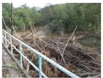
【流木支障】 石勝線 トمام～新得 トمام川橋りょう