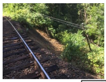
【盛土崩壊】 石北線 上川～白滝 76k690m付近