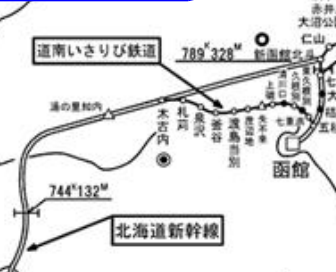
【北電受電停電】 函館線 森駅