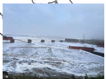
【橋りょう流失・路盤流出・通信ケーブル損傷】 日高線 豊郷～清島 慶能舞川橋りょう