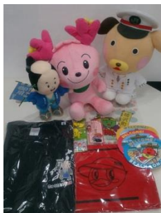
房総ご当地キャラクターオリジナルグッズ (イメージ)