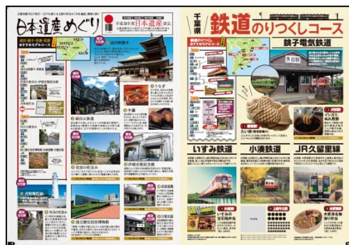
パンフレット特集ページ