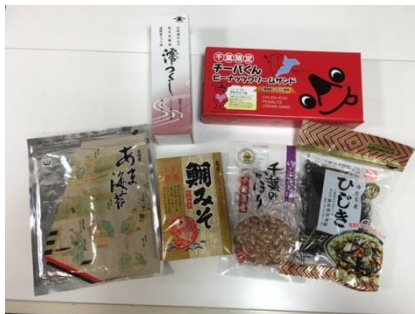
千葉県特産品詰め合わせ (イメージ)

※詳しくは「サンキュー♥ちばフリーパス」専用パンフレットまたはJR千葉支社ホームページ ( http://www.jreast.co.jp/chiba/ )、千葉県公式観光物産サイト「まるごとe!ちば」 ( http://maruchiba.jp/ ) をご覧ください。