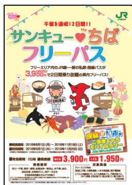
パンフレット表紙

パンフレットはJRの「サンキュー♥ちばフリーパス」発売箇所、その他首都圏の一部のJR駅・びゅうプラザ及び千葉県内の道の駅やチーバくんプラザなどで配布します。