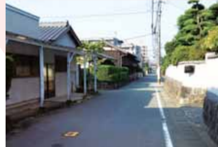
保田窪村地筒小路跡

校区では、にしばる桜まつりや校区大運動会の開催、災害を想定した大規模な避難訓練に力を入れるなど、各種団体が協力してまちづくりを進められています。