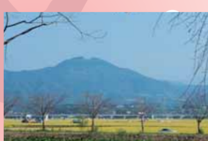
四時軒から見た秋津の田畑

【四時軒への交通アクセス】 (都市バス) 秋津小橋記念館前から徒歩 3~5 分 (産交バス) 秋津薬局前から徒歩 10 分~15 分、小橋記念館入口から徒歩 5~8 分 (ゆうゆうバス) 小橋記念館入口から徒歩 5~8 分 ※健軍電停からも出ています