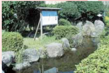
画図小学校内の汀女園