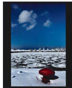
「春待つ漁港」大鹿 静彦（北見市）