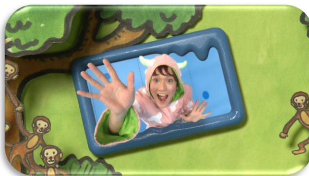
うた「オフロスキーのオーユー！」 作詞・作曲：小林顕作 編曲：ha-j