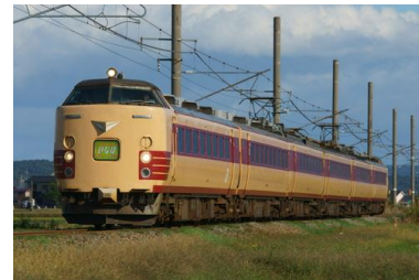
485系国鉄色車両(イメージ)

「いなほ」は1969年上野～秋田間を高崎・上越・信越本線・羽越本線を経由して気動車で運行を開始しました。1972年10月の電化により485系電車が投入され、1982年11月の上越新幹線開業から、新潟駅を発着する特急として、新潟～青森間を1往復運転しました。