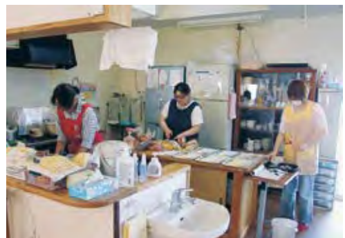
食事準備中の介護職員

二、介護職員処遇改善交付金事業の対象職員を対象職員以外の職種にも拡大すること。 を求める意見書です。