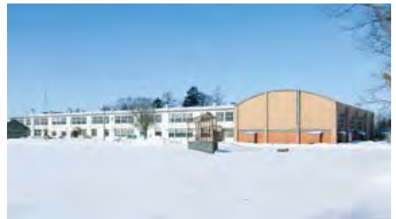
3月で閉校される磯分内中学校