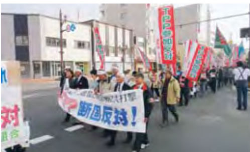
TPP反対釧根集会（釧路にて・11月3日）

また、勉強会については、関係団体と協議しながら進め、反対運動は、本町酪農畜産業の生き残りのため、農産物品質強化を機会あるごとに国、道に求めていきたい。