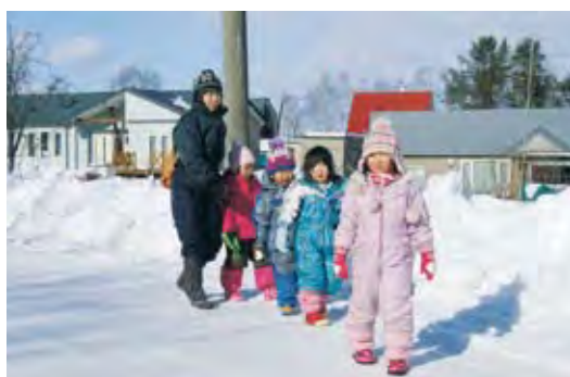
ひしのみ保育園のお散歩

「へき地保育所職員の給与に関する条例の一部を改正する条例の制定について」 人事院勧告に伴い一般職やへき地保育所職員の給与月額を平均で0・23%減額するものです。 ※賛成多数で可決されました。