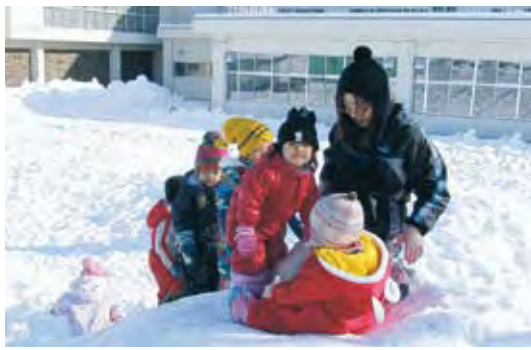
雪山で遊ぶ園児 (みどり保育園)

かな育ちを保障するために、児童福祉法二条二十四条に基づく現行保育制度を堅持、拡充すること。 二、市町村の保育実施責任をなくし、直接契約、直接補助、応益負担を原則にする「子ども、子育て新システム」は撤回すること。 三、保育制度の見直しに当たっては、地方自治体、保護者、保育現場等の意見を十分尊重し、慎重に検討すること。