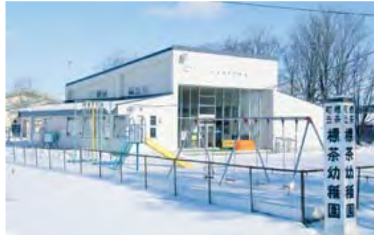
合築間近の町立幼稚園