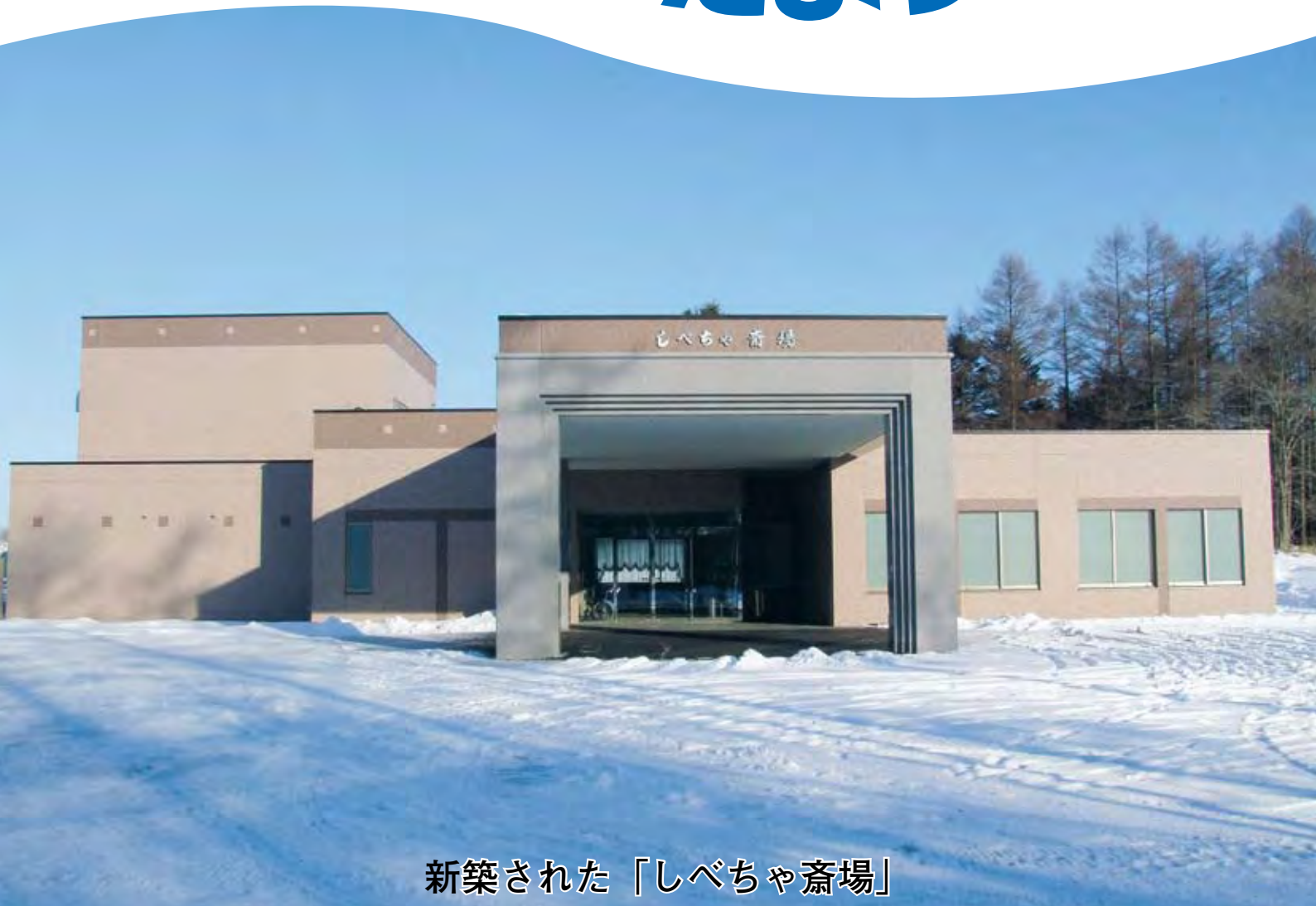
新築された「しべちや斎場」