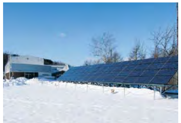
塘路小中学校の太陽光パネル

災害時のライフラインの確保は避難所として設定した場合、災害協定をむすんでいる事業体や町、関係機関等と連携する中、確保対策構築が現実的である。