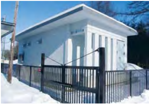
新しくできた水源地

向け着手している。本町は水源地が六カ所あり、水源地周辺を「水資源保全地域」と指定し、又、水源地周辺の土地所有者の把握も実施すべきと考える。道は、土地の買い主に適正な土地利用が図られるよう、水資源保全指針等に沿って助言する届け出制の導入を図ろうとしている。本町も適正な土地利用について売買時の届け出制の導入や地下水源及び水道水源保護条例制定等に向けた施策、取り組みが必要であると考えるが如何か。