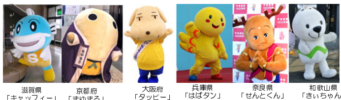
滋賀県「キャッフィー」 京都府「まゆまる」 大阪府「タッピー」 兵庫県「ははたん」 奈良県「せんどんくん」 和歌山県「きいちゃん」

※5月1日(木)大阪府、5月24日(土)和歌山の自動車税納期内納付啓発イベントでも、6体の“ゆるキャラ”が登場します。