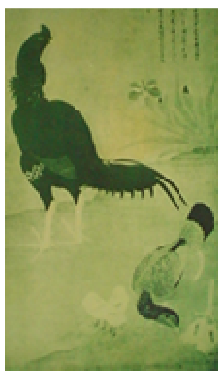
闘鶏花房の図（佐渡山安健筆）