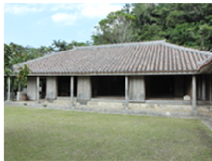
唄合せ会場（ふるさと園）