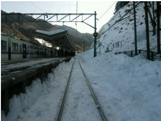
2月20日（木） 9時 芦ヶ久保駅3番線