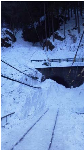
2月19日（水） 15時 川地隧道