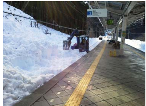
2月19日（水） 15時 芦ヶ久保駅3番線