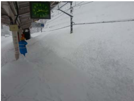
2月15日（土） 8時 芦ヶ久保駅3番