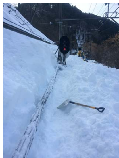
2月19日（水） 15時 芦ヶ久保～横瀬駅間の様子