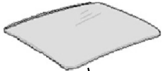
サンルーフガラス