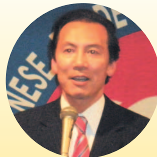
白石前衆議院議員