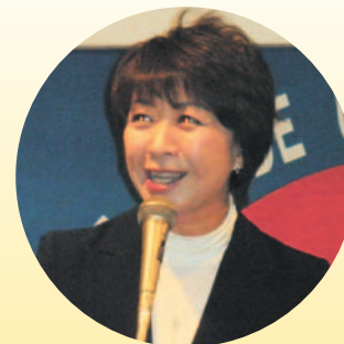
永江前衆議院議員