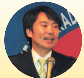
高橋前衆議院議員