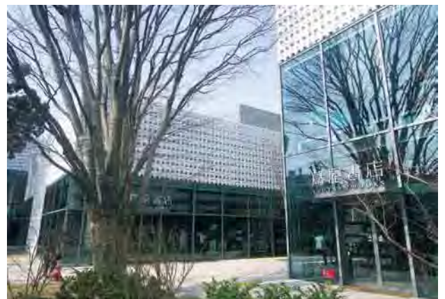
▲CCGが運営する「代官山蔦屋書店」(東京都渋谷区)