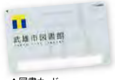
▲図書カード 「武雄図書館Tカード」

Tカード(Tポイント)とは…全国にあるTカード提携先で、利用金額に応じてポイント(Tポイント)を貯め、利用出来る共通カード。