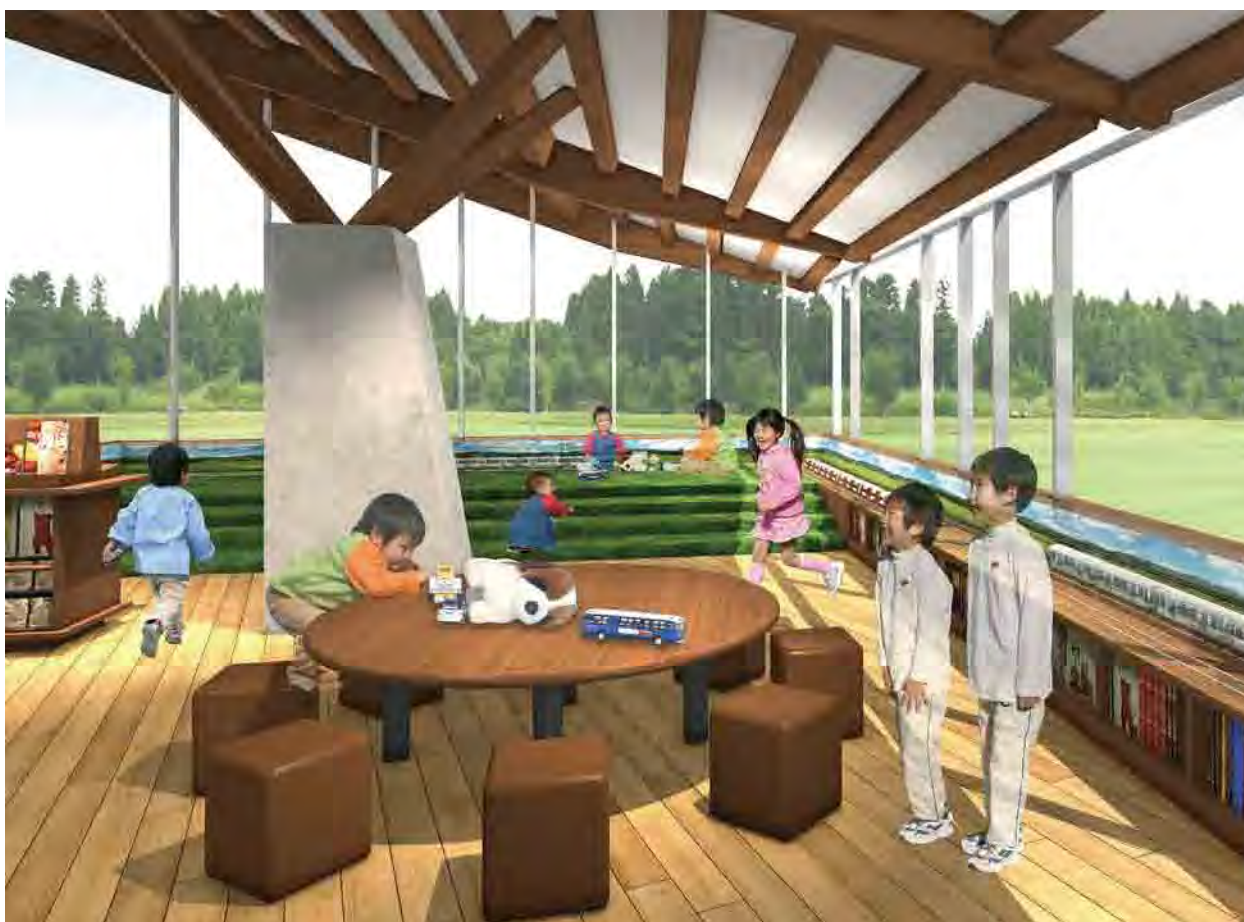
▲キッズライブラリー