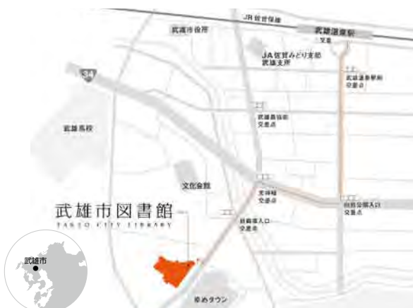
▲武雄市図書館周辺MAP