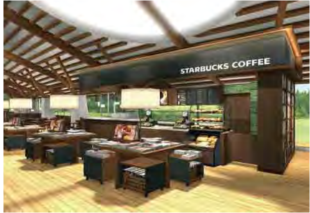
▲スターバックスコーヒーが館内に出店