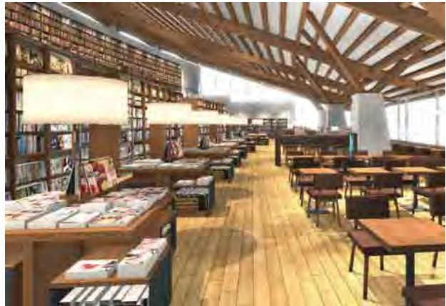
▲マガジンストリート(雑誌販売コーナー)