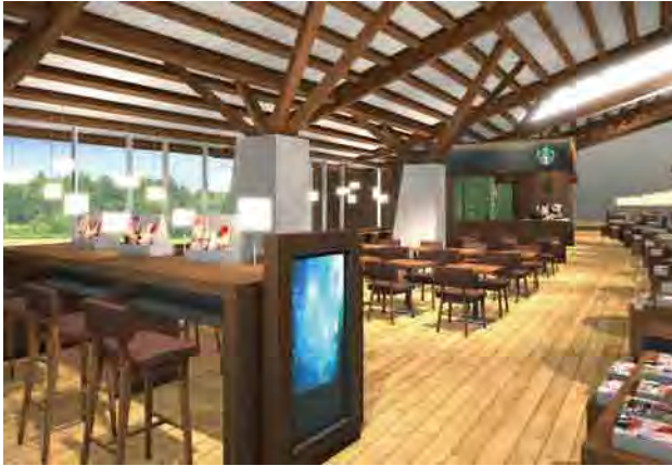
▲カフェダイニング