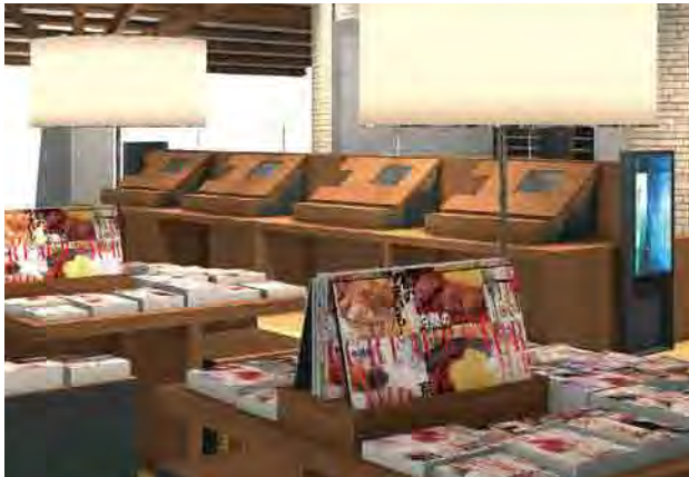
▲マガジンストリートと自動貸出機