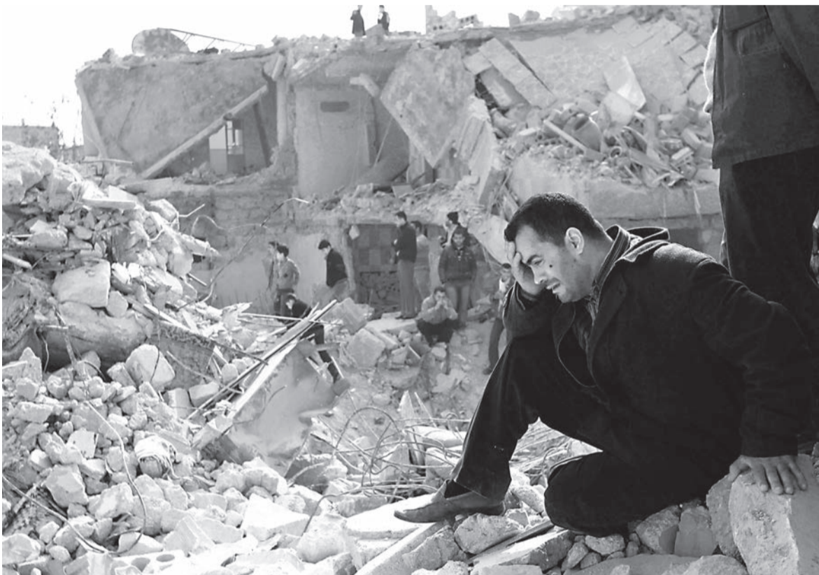
シリア第二の都市、アレッポ。ミサイル攻撃によって町は廃墟と化した。悲劇的な内戦を終わらせるために、今こそ「世界の警察官」が立ち上がるべきだ。

2011年から続くシリア内戦では、今までに10万人以上が犠牲となり、難民は200万人にのぼる。今年8月には、アサド政権側が使用したとされる化学兵器によって国民1400人以上が殺害された。これに対して、オバマ米大統領は、いったん介入を決定したが、「シリアの化学兵器を国際管理下に置く」というロシアの提案を受けて一気に軟化に転じた。 アサド政権をこのまま放置していいの？ また、アサド政権側、反政府側、どちらに正義があるのか？ 大川隆法・幸福の科学グループ創始者兼総裁は、このほど、アサド大統領の守護霊を招き、シリア国民や国際社会をどう見ているのか本心を探った。