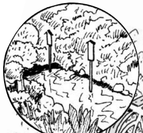
居醒の清水(平成の名水百選)・加茂神社

ゴール受付時間: ~15:00 ※ゴール受付時間外は参加証明スタンプの押印や仮の参加証明の配布などはいたしません。 コースの案内看板は、スタート受付終了後、スタートに近いものから順次撤去いたしますのであらかじめご了承ください。