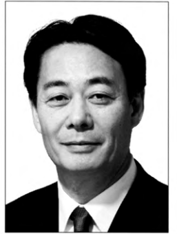
民主党代表 海江田万里

民主党は再生の第一歩を、文字通り地域を歩くことから始めました。ひたすら歩き、皆さんの声を聴く。そこで出会ったのは、ニュースからは聞こえてこない、小さな声、心からの切実な声。数か月に渡る行脚で、私たちが思いを新たにしたのは、「生活者の側に立つ」という原点でした。