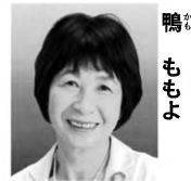
鴨ももよ 【両書き】全国ユニオン前会長 【政策・得意分野】 雇用と労働を再生、男女平等を 実現、脱原発を推進、憲法を活かす。