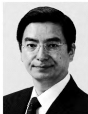
山本 ひろし 現 党参院副幹事長、慶應義塾大学卒。 参院議員1期、58歳。 どこまでも人間主義。