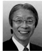
又市 征治 【両書き】参議院議員、 社民党全国連合幹事長 【政策・得意分野】 経済・労働・財政・エネルギー政策、 地方行政(憲法)