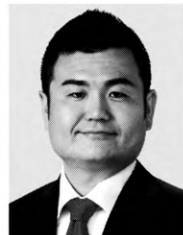
かの 義博 新 党青年局長次長、回国国際局長。 慶應義塾大学卒、35歳。 あなたの未来をむすびます