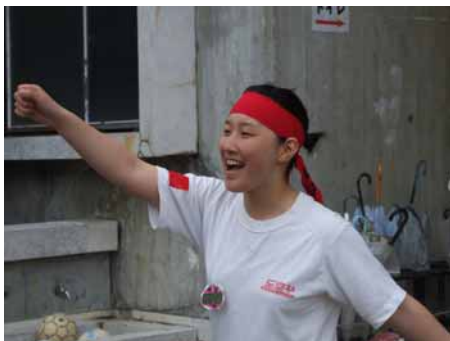
やったー！紅軍(赤組)イギョラ！