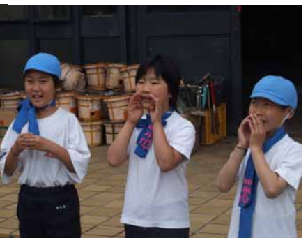
オッパ、オンニ、ヒムネラ！