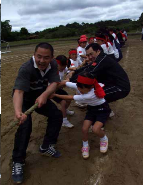
トンポと学生がひとつになって！！