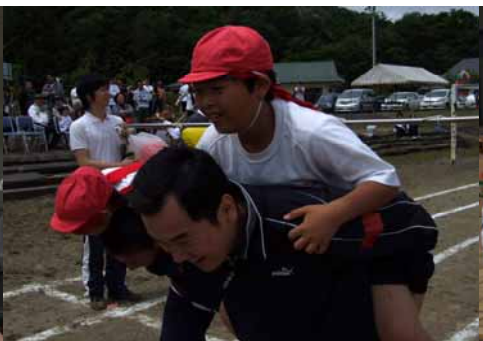
アッパ！はやく！（アッパは大変；”）