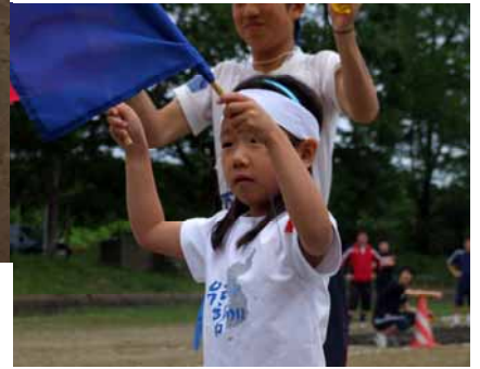
うまくいっただかな？