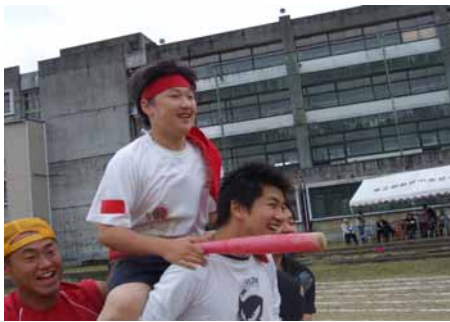
この勝負いただき！！