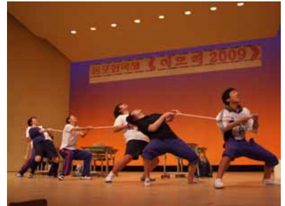
中央口演大会でも金賞を受賞した中級部の演劇「タギョウ」(綱引き)