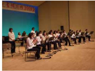
オモニ器楽演奏オンヘヤ