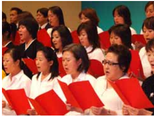
女盟オモニのパワーは凄い