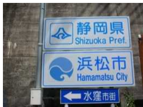
スタートの大嵐駅は静岡県

○スタートの大嵐駅は静岡県浜松市で、天竜川に架かる鷹巣橋を渡り対岸の愛知県豊根村に入り、天竜川を上流に向かって歩きます。小和田駅対岸を過ぎると長野県天龍村へ入り鶯巣梅の里ふれあい館でゴールとなります。一度に3つの県を歩くさわやかウォーキングです。