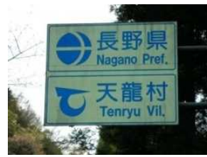
小和田駅対岸を過ぎると長野県

○ゴールの「鶯巣梅の里ふれあい館」では、ゆず果汁、梅漬けなどの地元天龍村の特産品の販売があります。また、お帰りの列車の時間まで御休憩できます。鶯巣駅までは、約200m、徒歩約5分です。