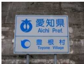
鷹巣橋を渡ると愛知県