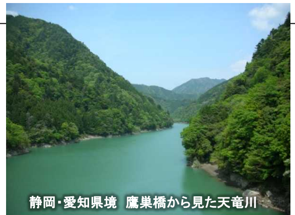
静岡・愛知県境 鷹巣橋から見た天竜川