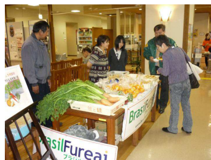
パレットフェスタ 2010