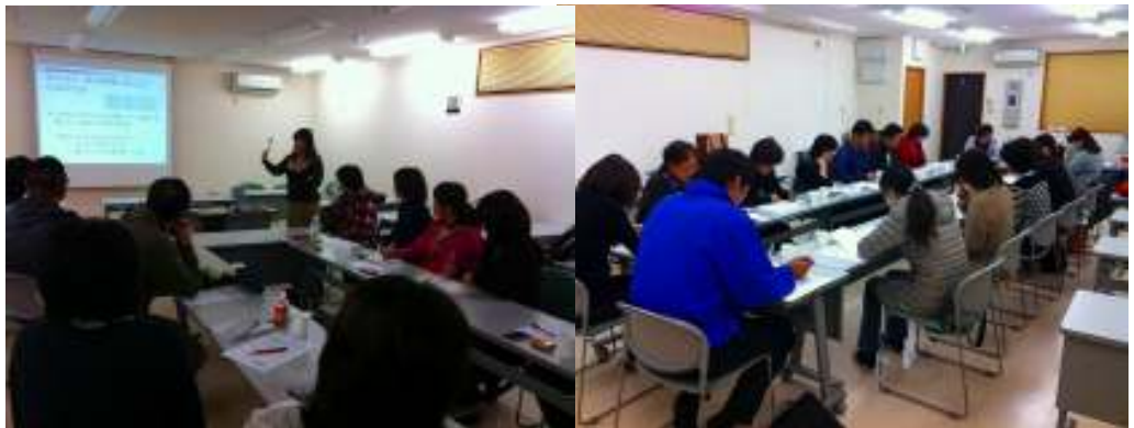
ネットワーク会議