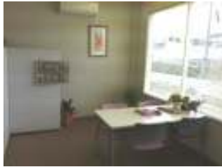
ネットワーク会議