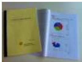
家族介護者実態・意識調査書

特定非営利活動法人 浜松介護サポート りらねっと 〒431-3105 浜松市東区笠井新田町970 TEL 053-545-7389 FAX 053-545-7395 E-mail liras@key.ocn.ne.jp