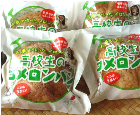
農業クラブ全国大会にて2年連続農林水産大臣賞を受賞!

これらの取組を日本学校農業クラブ全国大会にてプロジェクト発表し、2年連続農林水産大臣賞を受賞しています。