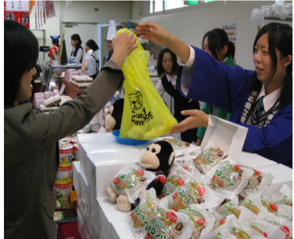
東京や熊本の百貨店で対面販売!