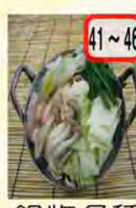
41~46 鍋物各種 一般 700円 会員 600円 もつ鍋は2種類あります!!