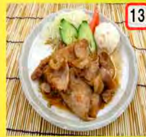
13 生姜焼 一般 450円 会員 400円 食欲進進!