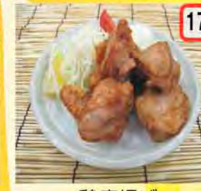
17 鶏唐揚げ 一般 450円 会員 400円 ジューシー~! ジュワア~!!