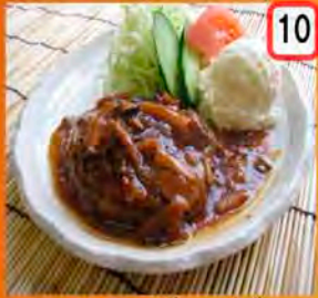
10 ハンバーグ 一般 400円 会員 350円 2種類から選べます