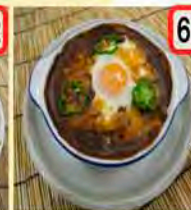
69 焼カレー 一般 530円 会員 500円 門司名物!