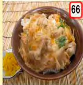
66 親子丼 一般 650円 会員 600円 親子の絆は旨い!