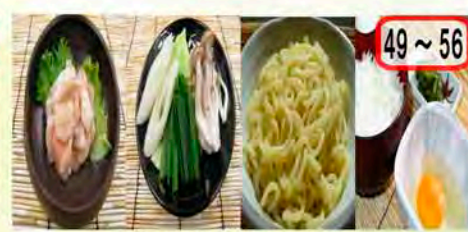
47~56 鍋用追加具材 お肉の追加やシメ具材を揃えています。 鍋と鍋追加具材、ドリンクのお得なセットもご用意しております。 大満足セット(鍋) 一般 950円 会員 800円 47・63