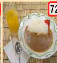
72 お子様カレー 一般 400円 会員 350円 お子様カレー