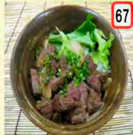
67 ステーキ丼 一般 700円 会員 650円 ガッツリ食べたい方向け