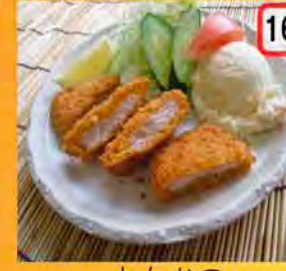
16 とんかつ 一般 500円 会員 450円 就活・婚活・とんかつ