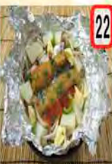
22 紅鮭陶板 会員 650