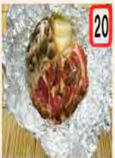
20 ラム肉陶板 一般 700円