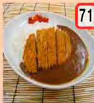
71 カツカレー 一般 650円 会員 600円 カツの分だけボリュームUP!