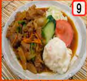
9 牛焼肉 一般 600円 会員 550円 ボリューム感有!

※全て単品となります。定食をご希望の場合は、おかずとは別に「定食セット」のチケットをお買い求めください。