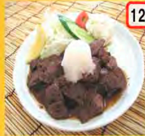
12 サイコロステーキ 一般 650円 会員 600円 ボリューム有ります。