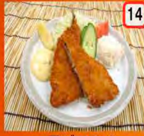
14 アジフライ 一般 350円 会員 300円 アジなフライはいかが