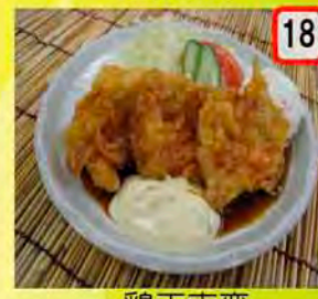
18 鶏天南蛮 一般 500円 会員 450円 衣に練り梅入ってます。