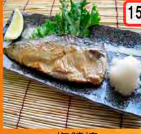
15 塩鯖焼 一般 450円 会員 400円 さかな、さかな、さかな~