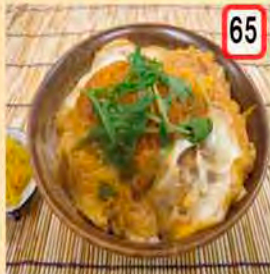
65 カツ丼 一般 650円 会員 600円 カツ丼食べて一勝負!