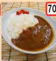
70 カレー 一般 500円 会員 450円 シンプルカレー