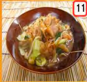
11 和牛ホルモン 一般 500円 会員 450円 スタミナ GET だぜ!!