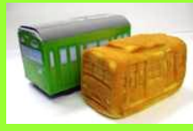
記念品イメージ(電車パン)