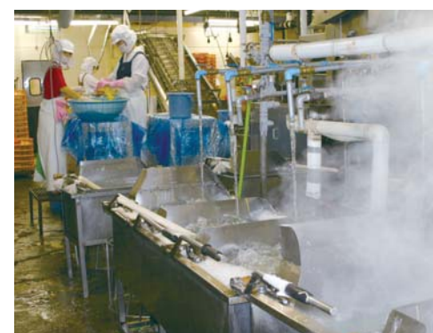
麺をゆで上げる工程床面はヌメリがつきやすい場所ですが、全くくきれいです。

工場清掃にEMを徹底的に活用、良い環境づくりに努めています。 「私は日本一元気な挨拶とすべてをビカビカにします!!」。取材に訪れると、昼礼の掛け声が工場の中から聞こえてきました。同社の製品のおいしさの秘訣は、実はこの「ビカビカ」にあります。設備は最新鋭でも、工場自体は古いところで47年も経過している同社。しかし、清掃を徹底して行うようスローガンに掲げ、良い環境を保つ努力を続けているのです。