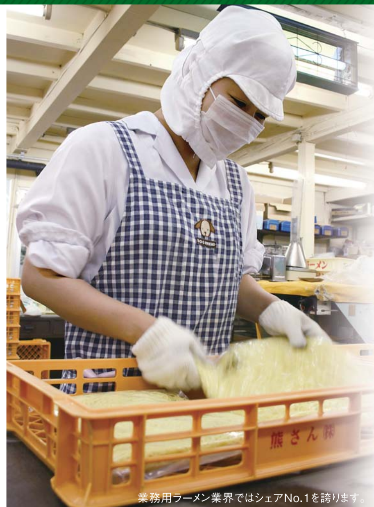
業務用ラーメン業界ではシェアNo.1を誇ります。

工場清掃にEMを徹底的に活用、良い環境づくりに努めています。 「私は日本一元気な挨拶とすべてをビカビカにします!!」。取材に訪れると、昼礼の掛け声が工場の中から聞こえてきました。同社の製品のおいしさの秘訣は、実はこの「ビカビカ」にあります。設備は最新鋭でも、工場自体は古いところで47年も経過している同社。しかし、清掃を徹底して行うようスローガンに掲げ、良い環境を保つ努力を続けているのです。