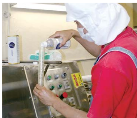
EM・X GOLDをすべての生地に配合。

生地を練り、24時間熟成する工程の担当の方は「EM・X GOLDを入れると生地の状態がしっとりとするので、入っていないものは触った感じがぼろぼろとするんですが…」と違いを強調します。同社では「まずはお客様の発展のため」という姿勢を掲げていますが、その根底にあるより良い商品づくりにも、EMが積極的に活用されています。