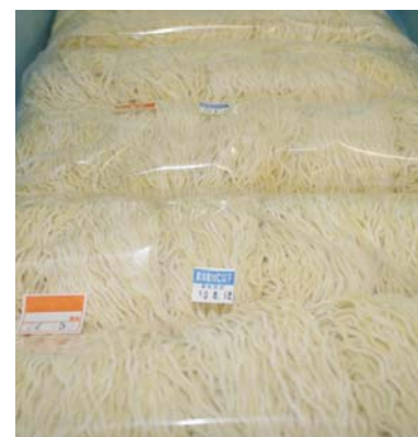
EM・X GOLDが配合されたラーメン。

ラーメン35種、冷麺30種、その他の麺類、餃子やしゅうまいの皮などの一日の生産量はなんと8万食！グループ全体の連結決算で100億円の売上を計上していますが、現在、そのすべての製品の生地にEM・X GOLDが配合されています。