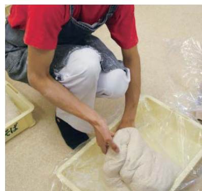
麺を熟成する準備。この後、延ばして24時間熟成させます。