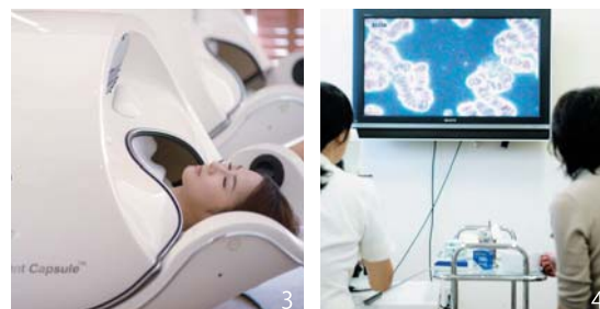
1.EMミストサウナでは、EM-X GOLD配合の霧に全身包まれることができます。2.厳選された鉱石にEMセラミックスを混ぜ、水の代わりにEM資材を活用して作られた岩盤浴。3.中に横たわるだけで心身ともにリラックスできる「EMカプセル」。4.クリニックでは「リフレッシュプラン」「血液サラサラプラン」などの健康チェックメニューもご用意。健康指導士から「病気になるための体づくり」のアドバイスが受けられます。