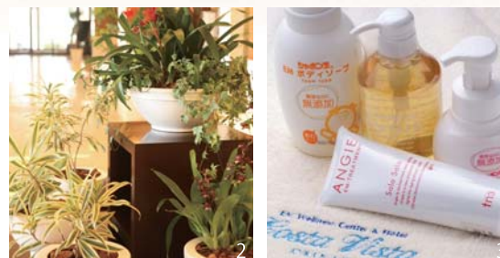
1.ゆったりくつろげ「ぐっすり眠れる」と評判の客室。2.ホテルの緑化にもEMボカシやセラミックスなどが活用されています。3.「EMシャボン玉石けん」ハンドソープや、EM配合の「アンジェ」シャンプートリートメントをご用意。