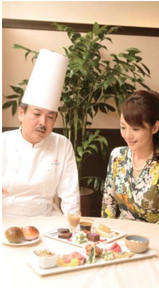
EM食材をふんだんに使ったスイーツやパン、沖縄料理などについても、シェフから参考になるお話を伺いました。