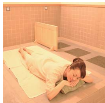
岩盤浴1回 500円 (別途、EM大浴場利用料が必要となります。)