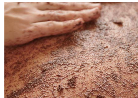
EMでパワーアップされた細かい粒々でやさしくマッサージすると毛穴の汚れが取れて、お肌はつるつる、しっとり!