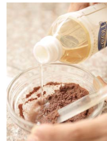
ワインの産地として知られるアメリカ・カリフォルニア州ナバ地区のブドウの種を細かくすりつぶし、EM・X GOLDを配合したスペシャルバージョン。