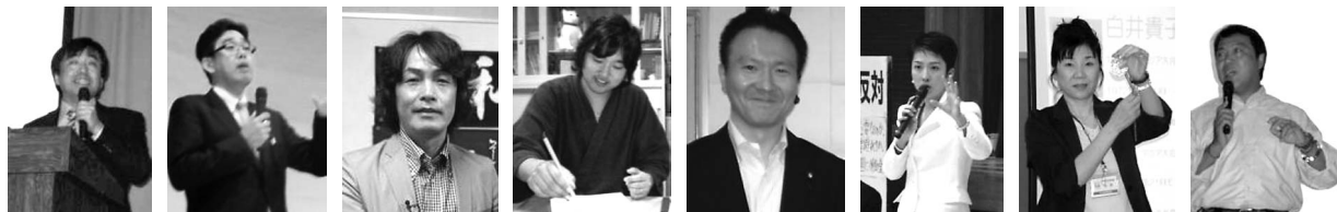
陰山英男先生 川島隆太先生 石田衣良先生 武田双雲先生 加藤紘一先生 蓮舫先生 白井貴子先生 奥寺康彦先生

現代社会の様々な問題をテーマに授業を行う。ゲスト講師には、著名な芸術家、スポーツマン、医者、政治家、会社社長から区役所職員まで様々な専門家をお招きし、現実の「よのなか」の面白さ、楽しさ、難しさをダイレクトに伝えてもらいながら、現代社会の「答えのない」課題に向きあう。