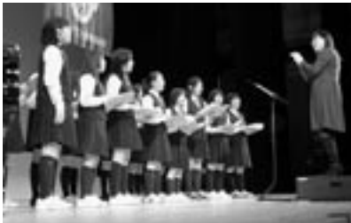
明るい歌声で会場の雰囲気もやわらかに...