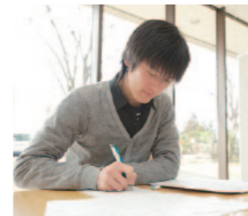
猿田さんの時間割(2年次後学期)