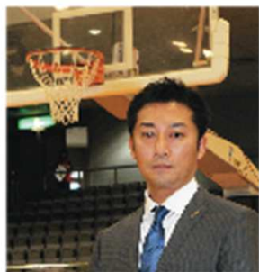
株式会社ASPE代表取締役

皆様におかれましては、ますますご清栄のこととお慶び申し上げます。 平素は格別のご高配を賜り厚く御礼申し上げます。 2011年10月、bjリーグに新規参入し、右も左もわからぬままファーストシーズンを駆け抜けてまいりました。