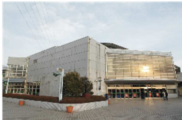
船橋アリーナ (船橋市総合体育館)

船橋アリーナ (船橋市総合体育館) 千葉ポートアリーナ 八千代市市民体育館 浦安市運動公園総合体育館 市川市塩浜市民体育館