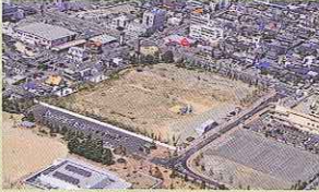
▲カネボウ跡地航空写真