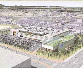
▲西大寺グリーンテラス完成予想図

この地は、明治29年創業の西大寺紡績が後にカネボウ綿糸西大寺工場となり平成6年にその歴史の幕を閉じるまで、商工業の町として栄えた西大寺地区の発展をけん引してきた場所のひとつです。