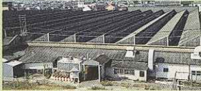
▲カネボウ綿糸西大寺工場