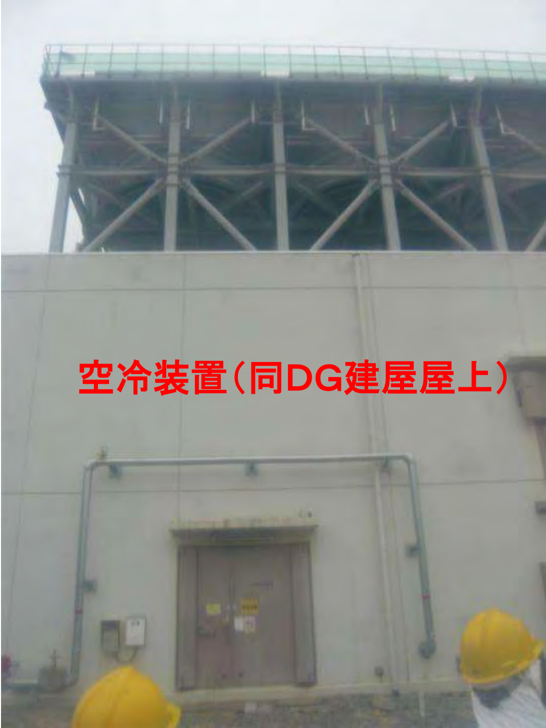
空冷装置(同DG建屋屋上)