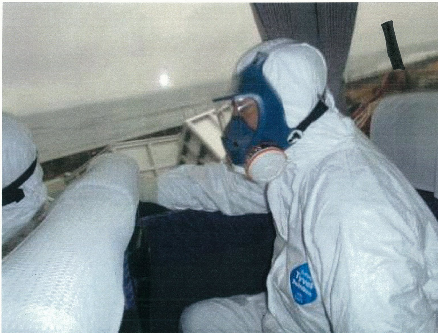
(8)現場視察(集中RW付近)