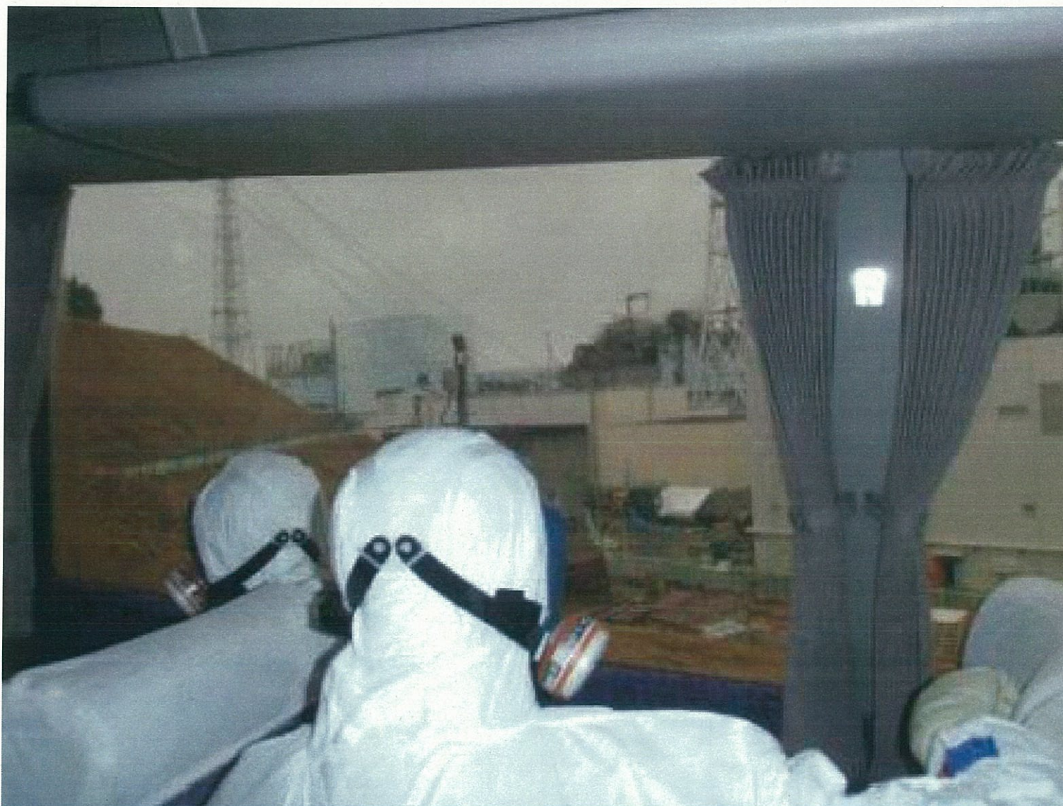
(6)現場視察4(1~3号機を望む)