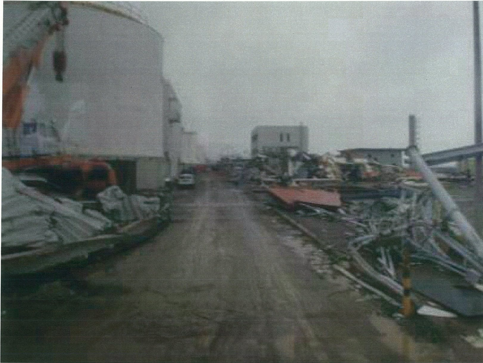
(4)現場視察2(4号機前から1~3号機を望む)