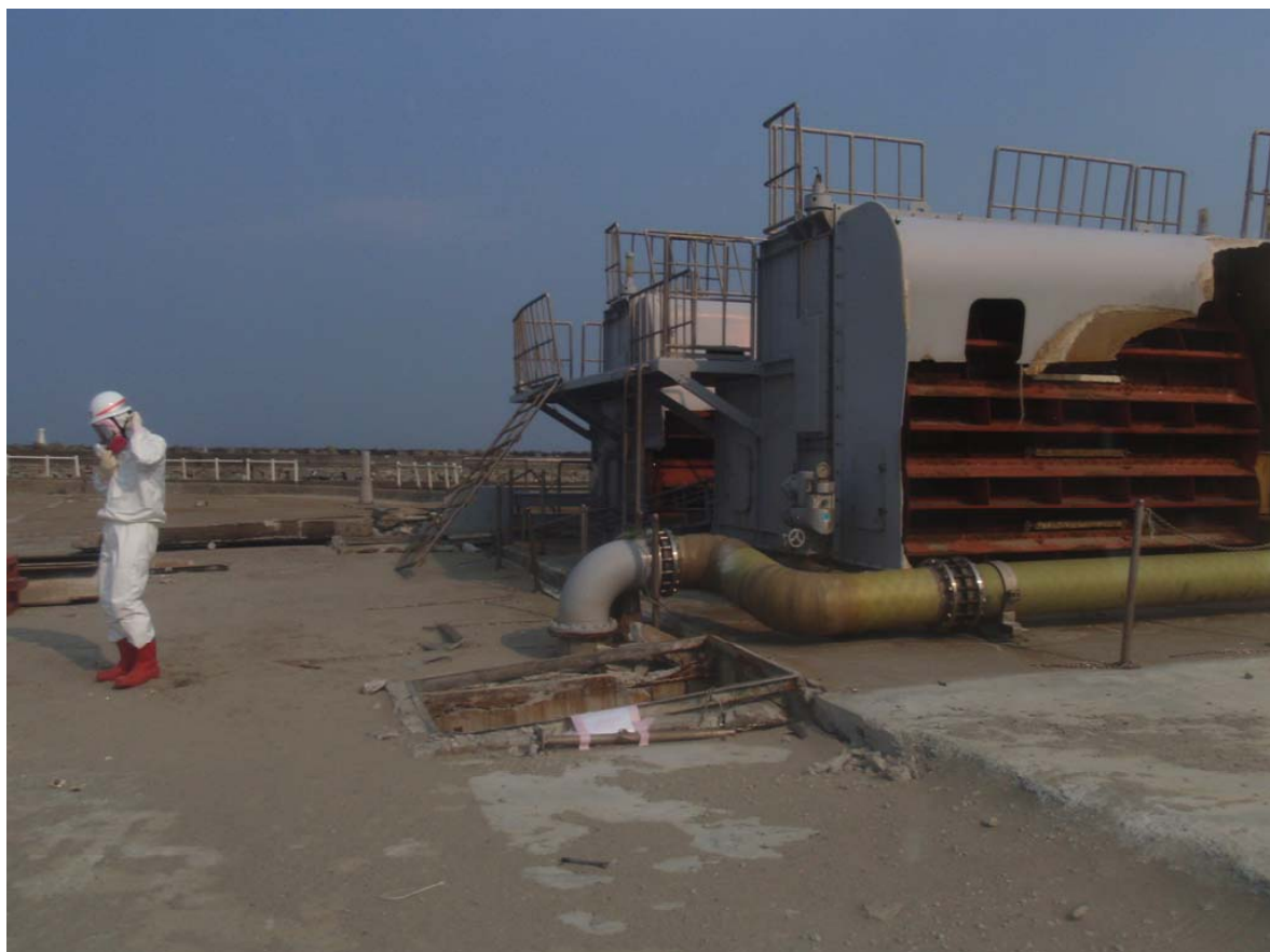
写真6 スクリーン設備本体(2)