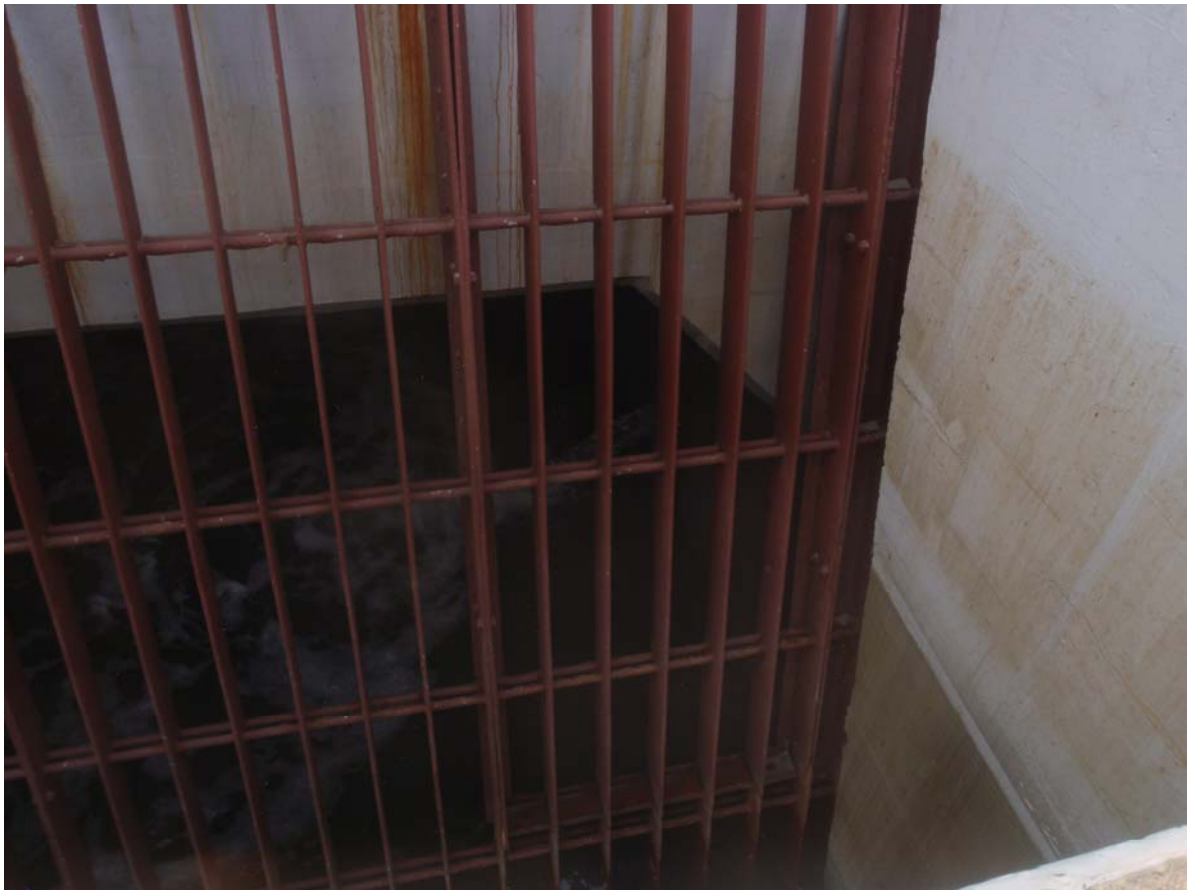
写真1 水漏れの状況(1)