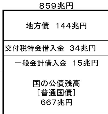
① 国と地方の公債等残高

一般的な政策経費や税収等と明示的・論理的に連動する国・地方の債務を集計。財政運営戦略の残高目標として用いられている指標。