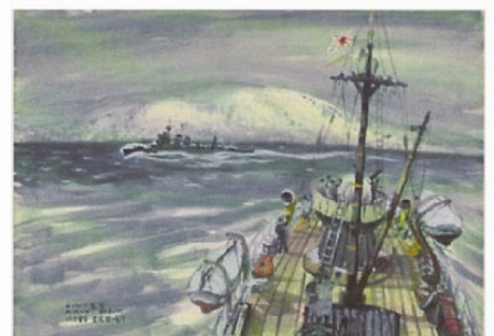
絵画「エトロフ遠望 北洋の守り」(昭和18年12月、水彩) 元海軍従軍美術家 高橋賢一郎画(当館蔵)