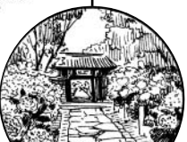
本光寺(宝物館は有料) W.C 紫陽花まつり会場

15時までに ゴールしてください。 コースの案内看板は、スタート駅 に一番近いものから13時頃より 撤去いたしますのであらかじめ ご了承ください。